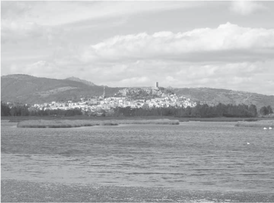
Figura 2: Il castello e il borgo di Posada, veduta dallo stagno Longo .