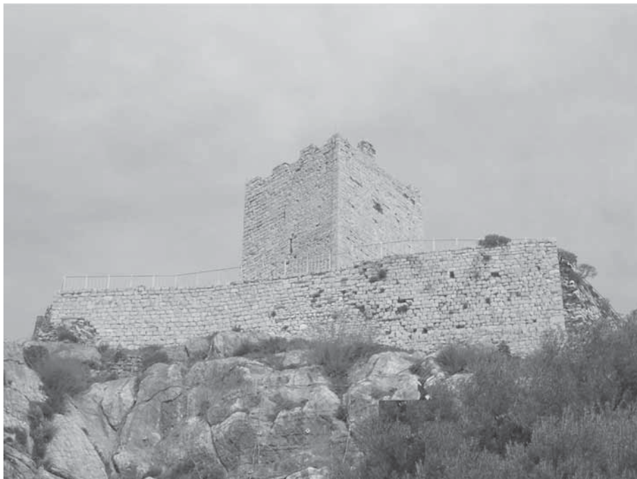
Figura 4: cinta superiore e mastio.