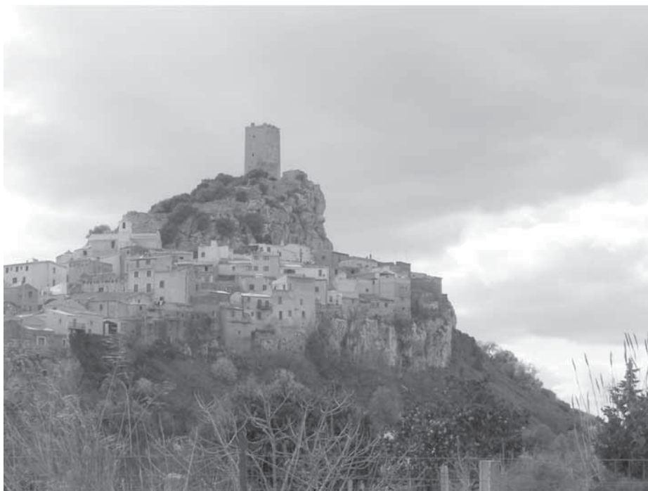
Figura 3: Il castello e il borgo di Posada.