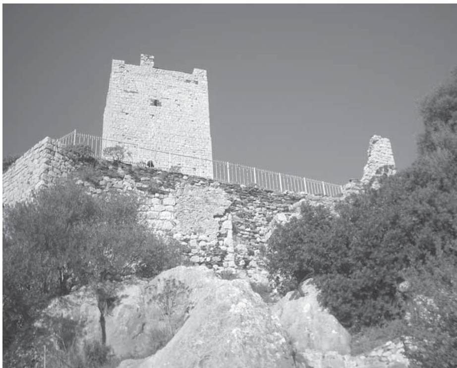
Figura 5: penultimo ingresso al castello.