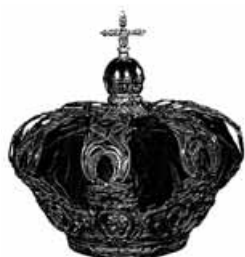
Corona Real Española.

En 1753, en Armari des Sies Claus, era corona reiau ei era pròpia dera casa de Borbon, causa logica se s'a en compde qu'era dita casa reinaue en Espanha des der an 1714 e qu'eth madeish Felip V ratifiquèc e confirmèc es Furs e Privilègis aranesi, e per tant era corona borbonica assumic en escut eth papèr qu'enquia alavetz auie amiat era d'Aragon.