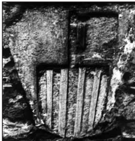
Casa "La Nheu" (Salardú).

Per aquerò sense renonciar ad aguest simbèu, un aute identifique ara Val d'Aran. Ena sua simbologia se mantié era identitat pròpia qu'ei consubstanciau ath nòste país, en tot establir un orde eraldic en quau es BARRES (paus), coma simbèu vengut der exterior deth nòste territòri, demoren en dusau lòc, mès en pè d'igualtat damb un simbèu mès pròpi, era CLAU. Per açò se partís pera meitat er escut. Era clau ei simpla e d'un lobul, color sable (nere, color deth hèr), en faisha e damb eth dentat, en tot guardar ara drete en forma de crotz. Clara allusion ar important papèr agut pera glèisa ena istòria d'Aran. Era CORONA REIAU represente a Aran des deth Tractat d'Emparança (1175) autreat peth rei Alfons II. Era representacion dera corona d'òr (auriò) ei pròpia des reis d'Aragon en sègle XIV. S'a adoptat eth tipe d'escut aragonés-espanhòu-quadrilong iberic, qu'a eth bèc redon.