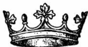
Rei d'Aragó Segle XIV (Bassa i Armengol).

Era corona reiau simbolize era apertenença d'Aran ath Reiau Patrimòni. Autant es bailes coma es bailes generaus, que posteriorament damb Alfons IV passèren a cridar-se governadors reiaus 5 , designauen un mòde particular de possession: ei eth dret d'administracion dirècta deth rei sense intermediaris.