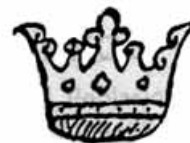
II Coronamtu regis aragonum

Enes descripcions der escut d'Aran non se parle dera forma dera corona. En 1613, sonque se descriu que i a ua corona reiau sus eri (es escuts). Mès enes diboishi des Glòses Marginaus deth Fori Aragonum 8 , trapam dejà ua representacion dera corona dera epòca e que seguís estant parièra ara que trapam coma corona deth rei d'Aragon, deth segle XIV. 9