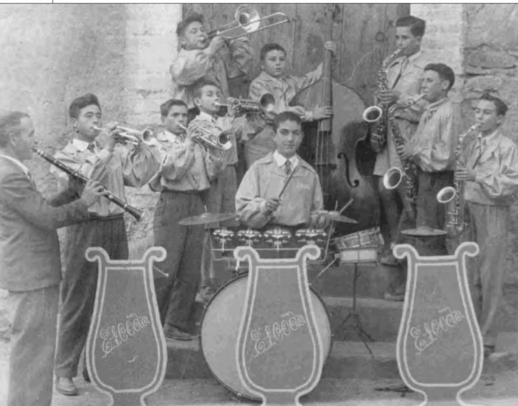
Orquestra Escoda, 1960