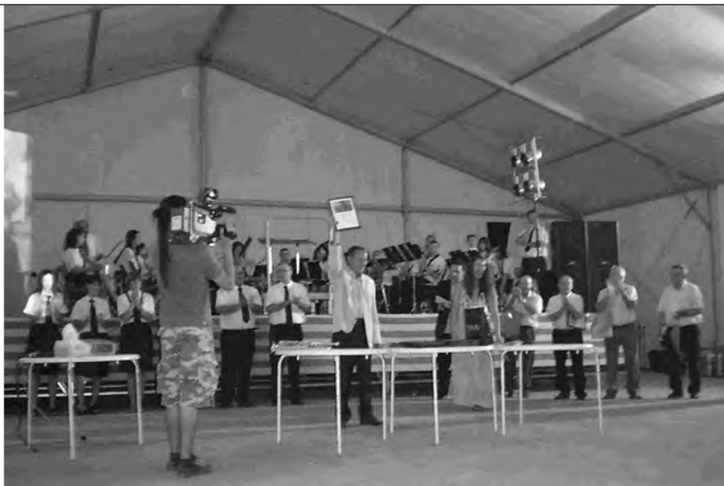
Festa de commemoració dels cinquanta anys de l'orquestra