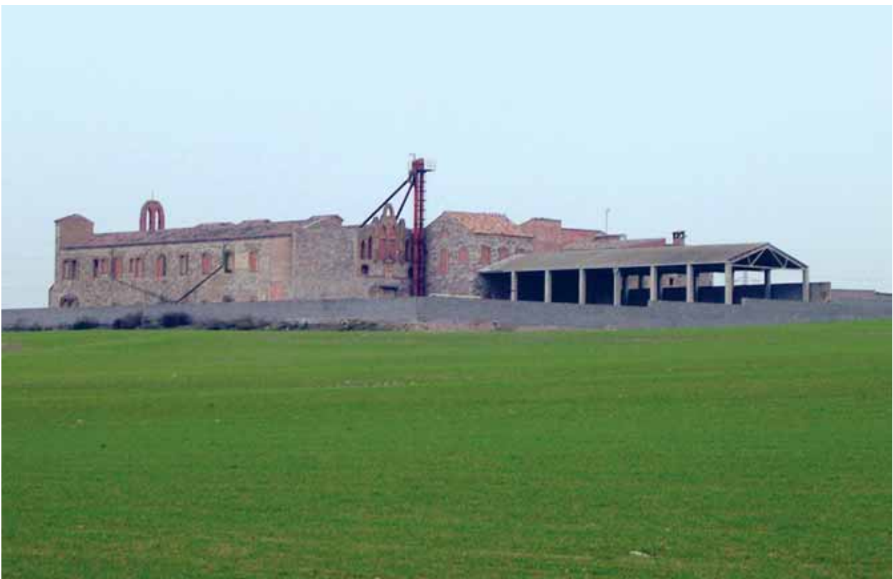
Fig. 7 Mas d'en Colom, seu d'un monestir cistercenc entre 1905 i 1920.

sant Eloi); el 6 de juliol de 1393 "l'home de confiança del rei a Tàrraga" (el batlle?), Joan Aguiló, rep una carta del rei, datada al mes de febrer del mateix any, per la qual ordena al veguer de Tàrraga que doni possessió a Aguiló del castell del Mor i altres termes de la vegueria, i l'endemà 7 de juliol de 1393 planten les forques com a senyal de jurisdicció; o la manifestació de la reina Elionor de Sicília contra Francesc d'Erill i d'Anglesola pels excessos comesos en les aigües del Mor. 34 Aquests problemes deriven fins a inicis del segle XIX. Vegeu com entre 1831-