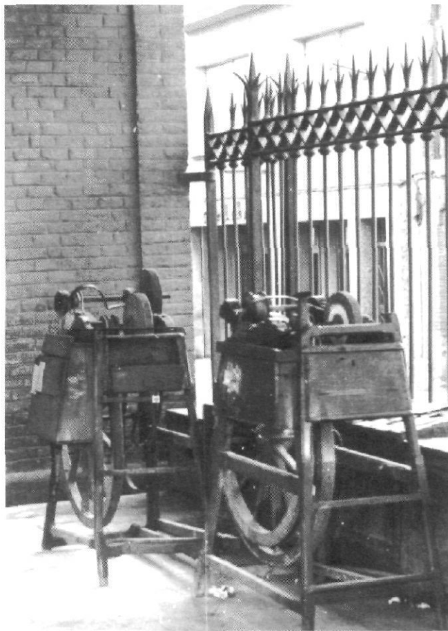
Carro d'esmolet.

Passaven pel carrer i cridaven l'atenció de les dones, oferint els seus serveis, fent un xislet característic, fregant