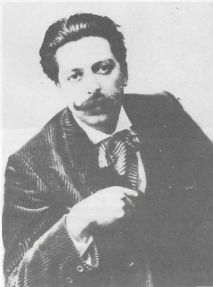
Enric Granados l'any 1900.

La seva producció musical és força extensa, i cal destacar-ne dues facetes: per una banda l'obra per a piano, de gran importància des del punt de vista qualitatiu; i per altra l'obra per a cant i teatral, també per dues raons: pel que representa en el context del modernisme musical en relació amb la creació del Teatre Líric i per extensió, de l'òpera catalana; i per la transcendència que tingué especialment la seva darrera obra, «Goyescas».