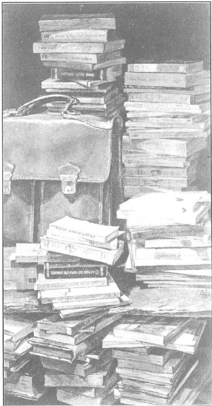
Fotografia d'un quadre de Parés de Mataró inspirat en Joaquim Casas.