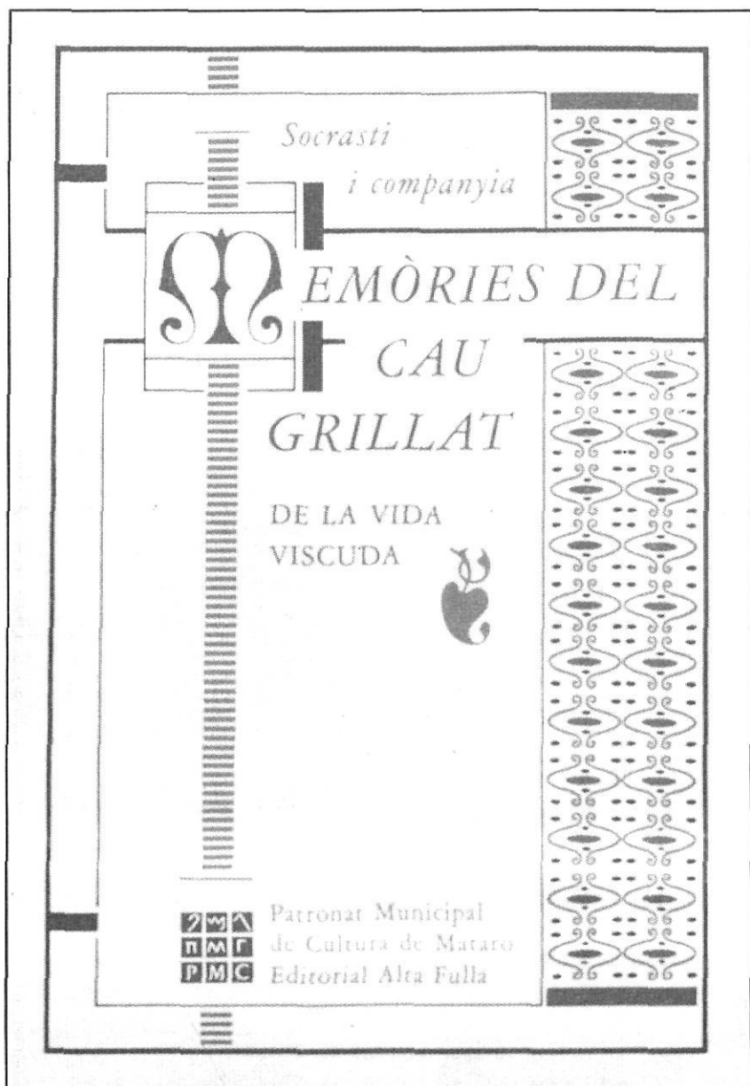
Portada del llibre Memòries del Cau Grillat (reedició de 1989).