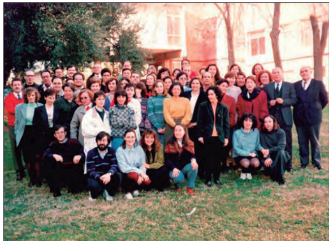
FIGURA 3. El col·lectiu de l'Institut de Tecnologia Química i Tèxtil als anys noranta.