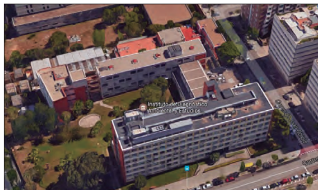
FIGURA 4. Panoràmica del CID en l'actualitat.

El segon projecte al CID serà la creació de l'Institut de Química Avançada de Catalunya (IQAC), el qual aplegarà, de manera no tan uniforme temàticament, grups que treballen en