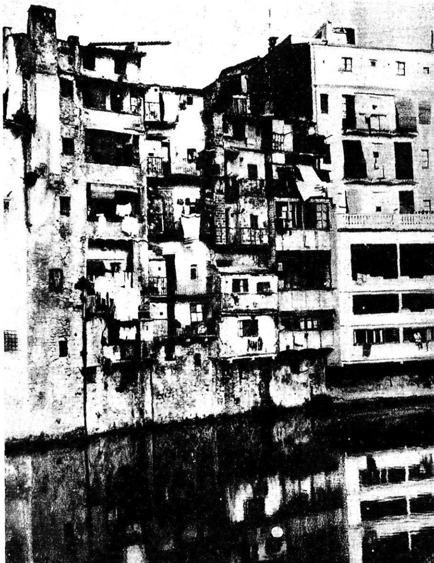
Una altra fotografia de Bucovich per a El Día Gráfico .