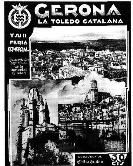
El suplement de El Dia Gráfico dedicat a Girona

Es passejà amatent pel barri antic, s'enfilà als terrats, a la muralla i als campanars, i es posà també entre els venedors del mercat. Panoràmiques, detalls de carrers, moments de la vida quotidiana... foren captats il·lusionadament per l'artista de la «càmera» i revalorats amb la seva mirada no acostuma-