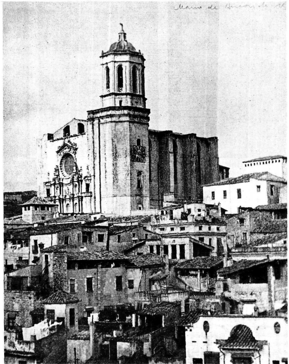
Fotografia de Màrius de Bucovich publicada al suplement de El Dia Gráfico (octubre de 1933).