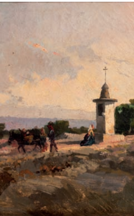
>> Josep Berga i Boix, (s.t.): Oratori al captard (1877). Oli/tela, 27 x 40 cm. Detall. Col·lecció particular.