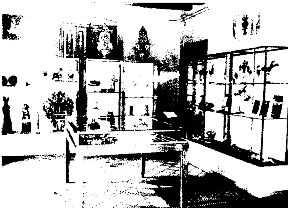
Antiga sala del Museu Etnològic de Barcelona.

lògic de Barcelona es pot relacionar tipològicament molt més amb el Museu Nacional d'Etnologia de Madrid (unit l'any 1993 al Museu Nacional del Poble Espanyol en crear-se el Museu Nacional d'Antropologia). Aquests són els dos únics centres d'entitat a l'Estat espanyol dedicats a la varietat cultural que tenen un abast mundial. Les seves concepcions anteriors, com a museus exòtics o bé com a destinataris dels fons d'altres museus, aquests sí concebuts explícitament com a colonials, formen part d'una història complexa: la seva història concreta com a institucions, la de l'antropologia com a disciplina, i la de l'Estat espanyol com a presumpta potència colonial.