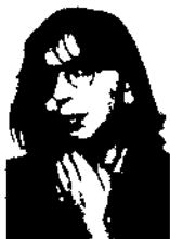
Carmen Ortiz García Departament d'Antropologia d'Espanya i Amèrica (CSIC. Madrid) Traducció: Xavier Ginestet

La història dels museus antropològics a Espanya és un relat de discontinuïtats i paradoxes. Les relacions entre colonialisme i antropologia tampoc han estat ben conegudes en el nostre passat. A partir de l'exposició de successives fundacions de museus colonials, s'intenta aportar alguns trets generals i conclusions que afecten a la història de l'antropologia, els museus i el colonialisme a Espanya.