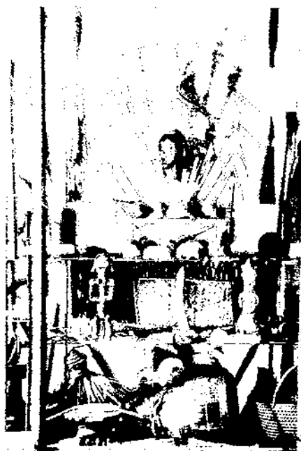
Una de les entrades del Museu d'Etnografia de Trocadero. París. 1882.