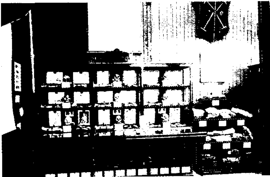
Pavelló central de l'Exposició de Filipines de Madrid. 1887. Secció d'Antropologia.

una sèrie de centres que, o bé han aconseguit mantenir-se fins avui com a tals institucions, o bé han contribuït considerablement, amb els fons documentals i col·leccions d'objectes que reuniten, a la configuració del nostre patrimoni cultural i etnogràfic. Així, la no consecució d'un pla ideal (o no ideal, però sí global i complet) no pot jutjar-se com un fracàs absolut, ja que durant períodes successius s'aconseguien plasmacions concretes, que són els museus que a hores d'ara tenim. Ha de ser una tasca del futur incrementar, consolidar, i organitzar en una xarxa àmplia i variada aquest llegat, o bé enterrar per sempre algunes antigalles massa velles com a projectes. Dins l'ampli espectre que poden abastar els que