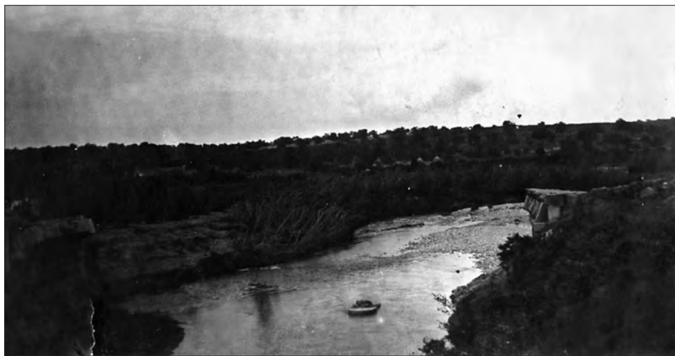
□ Imatge del riu Gaià a l'alçada del pont dies després de la Gaianada.

Els antics rierencs, i els nostres avis encara avui dia, diferencien també el que és una torrentada d'una gaianada. Una torrentada és una vinguda d'aigües sobtada a través del torrent sec després d'un període de pluges intenses als pobles i serralades interiors com la Nou i Salomó fins arribar a les muntanyes de Montferri.