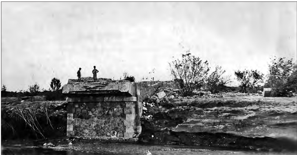
☐ Restes del pont que va prendre la gaianada (1921).