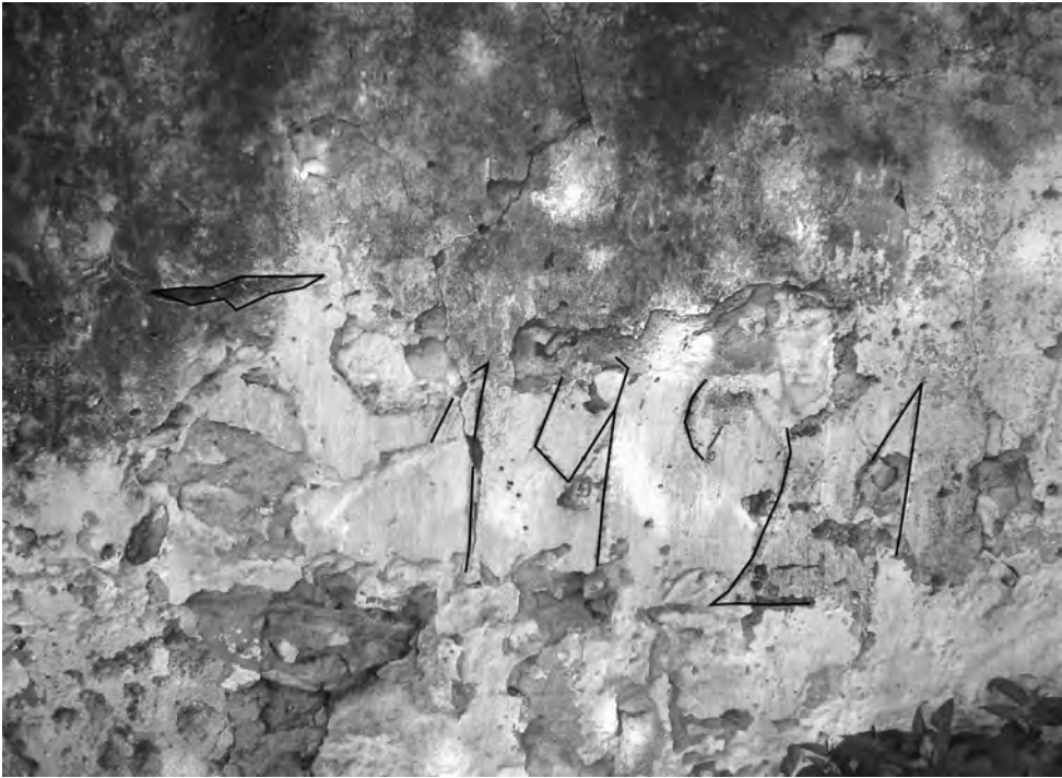
□ Grafiti que recorda fins on va arribar l'aigua a l'any 1921 a Mas de Sendrós.

Els conreus de la vora del riu van anar canviant amb l'entrada al segle xx. Entre els anys 1905 i 1910 s'introduí massivament el cultiu de l'avellaner a l'horta rierenca, fet que ja va suposar un cop dur al conreu del cànem, del lli i del cereal. La nit de la gaianada del 21 es pot considerar com l'acta de defunció del cànem a la Riera, que havia tingut una importància cabdal en l'expansió de la indústria a domicili, és a dir, els teixidors, i de retruc pel creixement del poble al segle XVIII. No hem d'oblidar que la Riera, durant el set-cents i el vuit-cents, va ser el poble on hi havia més teixidors i aprenents de tot el Baix Gaià.