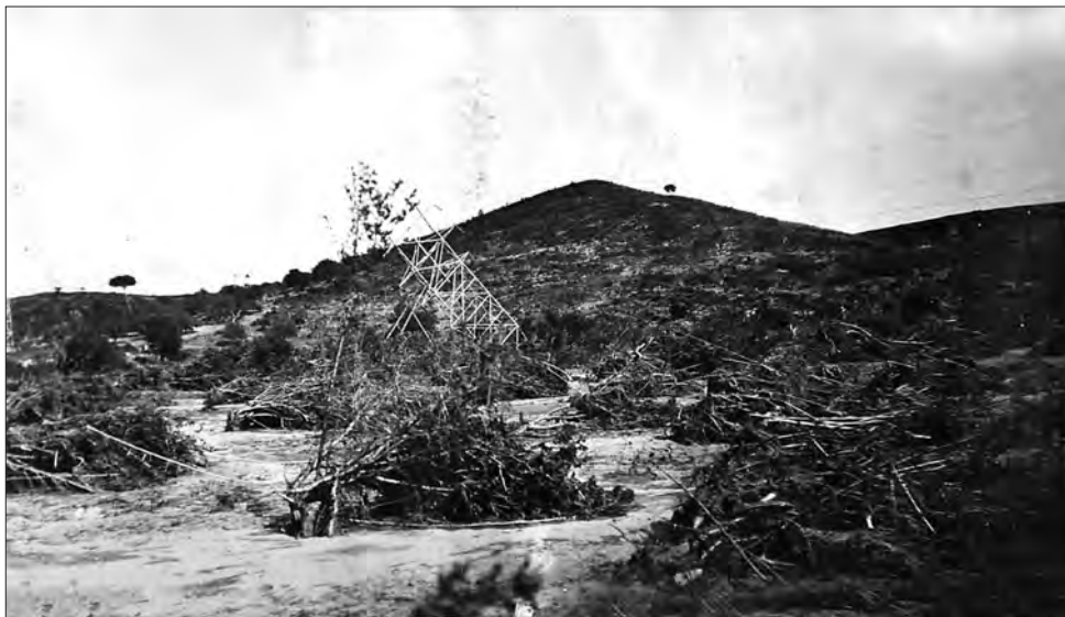
□ Imatge dels avellaners arrancats per la gaianada a l'alçada de la partida de Mas de Benet (1921).

barranco, se halla vaciada, rellena de barro y piedras sin vestigios de camino transitable. A derecha e izquierda, [plana de Ferran] llanuras inundadas, lodazales, campos cubiertos de avellanos conservando su codiciado fruto, que la corriente arrancó de cuajo y dejó tumbados, semejando tumbas de un cementerio fantástico.