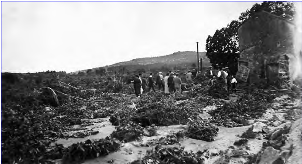
□ Imatge de les destrosses de la gaianada a l'alçada de la Torreta.

A les hortes i camps de la vora del riu no hi quedava res viu, només hi havia multitud d'arbres tombats i tones de fang i pedres que havien estat desplaçades per la riuada. D'arbres arrancats n'hi havia molts, sobretot els avellaners que s'havien plantat al poble feia pocs anys en grans quantitats en substitució de l'històric cànem. Els propietaris van haver de fitar una altra vegada les seves terres perquè les referències s'havien extraviat.