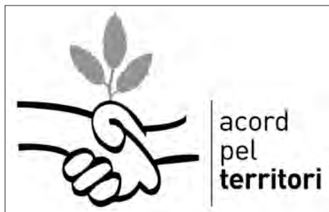
□ Figura 1: Logo dels Acords pel Territori del GEPEC-EdC.

legal. Tanmateix, si el propietari decideix requalificar a urbanitzable la seva finca o permetre una agressió ambiental greu, a l'hora de la veritat, les possibilitats que succeeixin aquestes agressions són força menors que respecte a altres finques. Un dels motius és que els acords morals sovint tenen més força de la que se'ls atorga. Al castell de Montesquiu l'any 2000 es va celebrar un Seminari que, tres anys després, va acabar constituint legalment la Xarxa de Custòdia del Territori ( www.custodiaterritori.org ). El GEPEC-EdC va participar en ambdós esdeveniments i en altres posteriors però no ha estat fins l'any 2008 que ha començat a posar en pràctica l'estratègia com a entitat. A l'actualitat, GEPEC-EdC té signats Acords pel Territori per sis finques que sumen 47 hectàrees en total. El 52% de la seva superfície total és forestal i el 48% restant és de caràcter rural. Els municipis on es troben són el Catllar, Roda de Berà, Alcover, Pratsdip (dues) i Vilaplana.