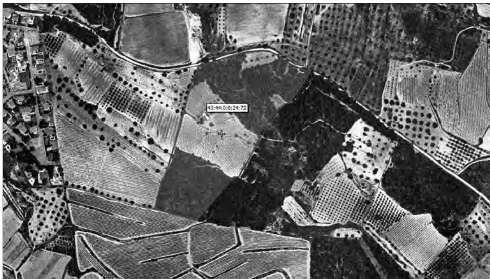
□ Figura 5: Fotografia aèria en què està inclosa la finca de Mas de Vicenç. Al nord el camí la separa de l'EIN "Riu Gaià-Albereda de Santes Creus".

Aquesta finca com altres, s'ha inclòs en algun projecte de finançament públic i privat a l'espera de poder avançar més acceleradament en la seva conservació: tanca cinegètica educativa, pla de gestió, instal·lació de caixes niu de ratpenats, etc.