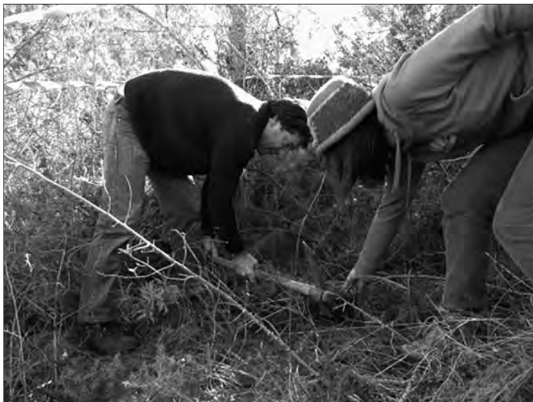
□ Figura 4: Treballs de voluntariat (sembra d'aglans) en els que participa tant la família propietària com voluntaris internacionals del GEPEC-EdC.

Aquesta finca com altres, s'ha inclòs en algun projecte de finançament públic i privat a l'espera de poder avançar més acceleradament en la seva conservació: tanca cinegètica educativa, pla de gestió, instal·lació de caixes niu de ratpenats, etc.