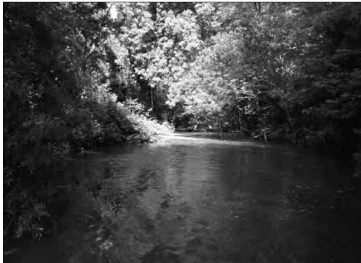
□ Figura 5: El riu Gaià al seu pas per Querol presenta uns índexs ecològics bons.

L'índex FBILL abans de la depuradora ja és dolent; això potser a causa de les nombroses granges de porcs presents en la zona i alguns nuclis habitats aigües amunt que no formen part de la xarxa de clavegueram de Santa Coloma. Després de l'efluent la qualitat biològica del riu encara baixa més (taula 2), fins a 2. Amb gran presència de Chiromidae vermells que determina la gran presència de matèria orgànica a l'aigua. Aigües avall l'índex augmenta fins a 7 ja que el cabal del riu augmenta fins a 7 vegades i durant el seu recorregut s'autodepura i la manca de nuclis de població importants fa que es pugui mantenir una bona qualitat; però això no sempre és així, com més endavant es discuteix.