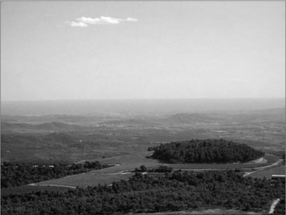
□ Figura 6: Des del cim de Montagut es veu el mar, on el riu Gaià hauria de desembocar, però actualment la totalitat del seu cabal queda retinguda al pantà del Catllar.