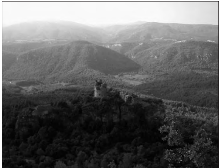
□ Figura 3: El castell de Pinyana és un dels castells que segueixen el riu Gaià.