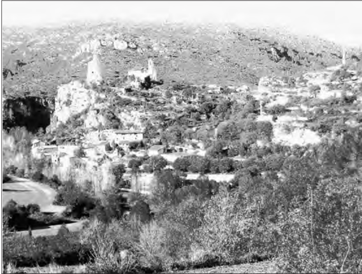
□ Figura 2: El poble de Santa Perpètua amb l'església i la torre del segle X.

Un altre espai significat i diferenciat a partir de la presència de terres de conreus el trobem situat al nord d'Esblada, ocupat pels cereals i recentment també per la vinya. De terres més aviat fosques, vermelloses, en pujar del sud resulta un espai suau i amable després de passar la zona muntanyosa del Gaià.