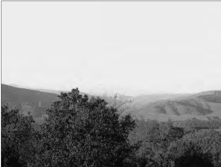
□ Figura 1: Al fons de la imatge s'observa els Pirineus i la Baixa Segarra, on neix el Gaià. Aquest poc després del seu naixement entra al Bloc muntanyós del Gaià.