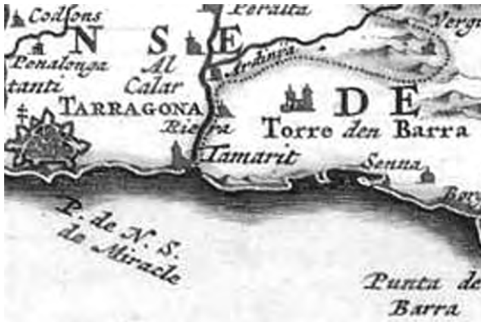
Detall d'un plànol de Catalunya del Segle XVIII. Institut Cartogràfic de Catalunya

Potser commemorar un fet bèl·lic amb el nom de “ festa ” no sigui el més encertat. Així mateix, si bé no deixa de ser un element simbòlic, el lloc on es va col·locar la placa commemorativa (als peus de la Torre) indueix a l'error de pensar que la batalla fou dins de la població i no en camp obert. D'altra banda, que per motius de calendari turístic traslladem la seva commemoració dos mesos abans, no encaixa amb el mínim rigor que demana la reconstrucció històrica.