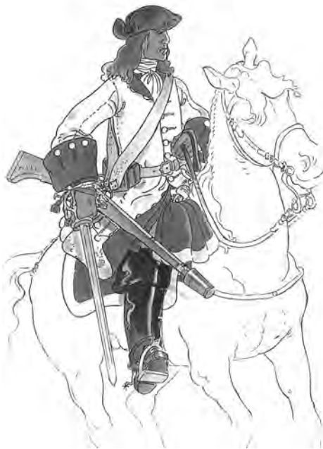
Genet del Regiment Nebot. Casaca blanca i jupa blava Autor: Francesc Riat

El govern català no disposava de recursos ni gaires tropes, es calcula que a Barcelona hi havia un exèrcit d'uns 5.600 homes format per una minúscula força reglada composta per: regiments de la Ciutat i la Diputació, el grup de fusellers i la Coronela. A banda, hi havia part del regiment de cavalleria Nebot, que no s'havia embarcat. Solament tenia com a fortalezes sota el seu comandament Barcelona, Cardona i Castellciutat. Per tant, la principal i, potser única opció, era resistir a Barcelona, única plaça forta capaç de resistir les investides borbòniques. Tot i així el govern intentà almenys salvar les places fortes per tal de multiplicar els fronts i donar temps al rearmament. S'enviaren cartes a Castellciutat i Cardona ordenant la defensa i cartes als governadors d'Hostalric i Tarragona per tal que no lliuressin les places sense batalla.