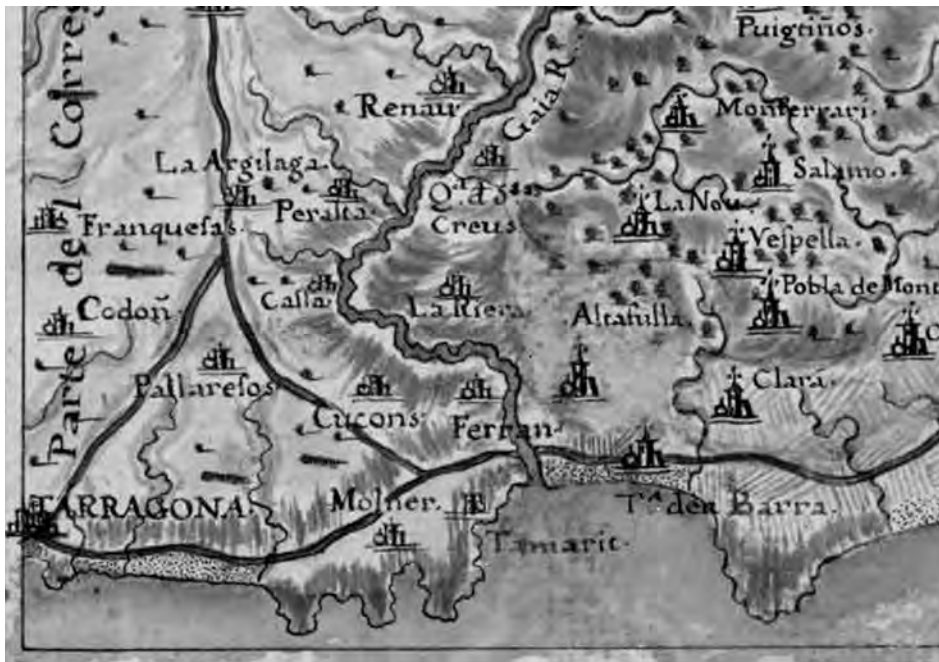
Vista parcial del corregiment de Vilafranca on estava adscrita Torredembarra i Clarà. El Gaià feia de divisió territorial entre els Corregiments de Vilafranca i Tarragona. Institut Cartogràfic de Catalunya.

En l'àmbit local, els canvis propiciats pels borbons no van anar malament del tot. Com ens diu S. Rovira: “un dels elements que facilitaren el desenvolupament econòmic de Torredembarra – així com les poblacions veïnes d’Altafulla i Creixell – durant la primera meitat del segle XVIII, fou la concessió a la duana de Torredembarra del dret d’entrada de mercaderies estrangeres i de fora del Principat” 24 . Aquest dret, que perdurà fins l’any 1770, fou molt important per l’economia local i, sens dubte, un dels motius que expliquen l’elevat increment de població durant el segle XVIII.