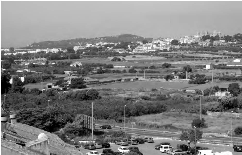
La batalla es lliurà en camp obert, entre Altafulla i Torredembarra

Certament, Felip V havia ordenat expressament a mitjan 1713, en el moment de planificar l'ocupació militar de Catalunya, que: