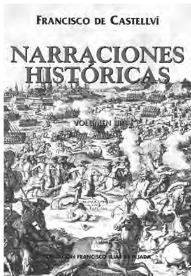
Portada del llibre Narraciones Históricas , de Francesc de Castellví.

Nasarre le replicó que la acción era ganada de ser mas gente y de mejor calidad; que para perder aquella ocasión era mejor hacerse frailes. En fin, convino el general en emprender el ataque mas por complacer a los voluntarios de Aragón que por juzgar ventajosa la acción. Dispuso sus gentes, formó tres pequeños batallones de los voluntarios y les dió la vanguardia. Los fusileros de Ferrer y Falcó les apostó tras de los voluntarios. Dividió la caballeria, tres escuadrones a la parte de la marina en una colina aguardando las avenidas de Tarragona. Apostó dos escuadrones a la parte de tierra en otra colina a la parte de la montaña. Cuando el general Nebot hacia estas disposiciones los granaderos del general González ocuparon unos huertos junto a la Torredembarra. Los voluntarios y fusileros iban avanzando con coraje los huertos y al empezar el fuego el capitán Ambrós, del regimiento de Nebot que le servia de ayudante, dio la voz a la caballeria de la izquierda, diciendo: “Retirese que el socorro ya está aqui”. El teniente Osorio, aragonés, dio la misma voz a la caballeria de la derecha. Desamparó la caballeria a la infanteria. Advertido el general González que la infanteria se retiraba sin ordenanza, mandó a toda su caballeria dar sobre los voluntarios y fusileros y a poca costa tomó 400 prisioneros y dejó sobre el campo de 70 a 80 hombres y siguió mas de media hora el resto de la gente.” 16