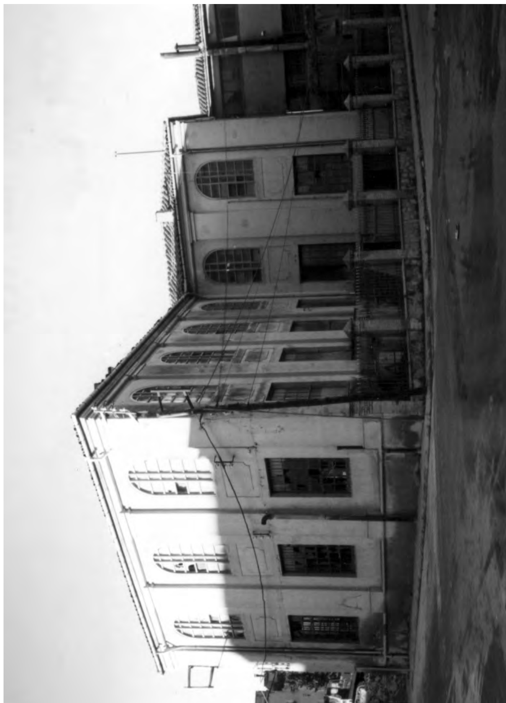
Fàbrica de Josep Domingo durant l'enderrocament de l'edifici del carrer Jacint Verdaguer. Any 1997.