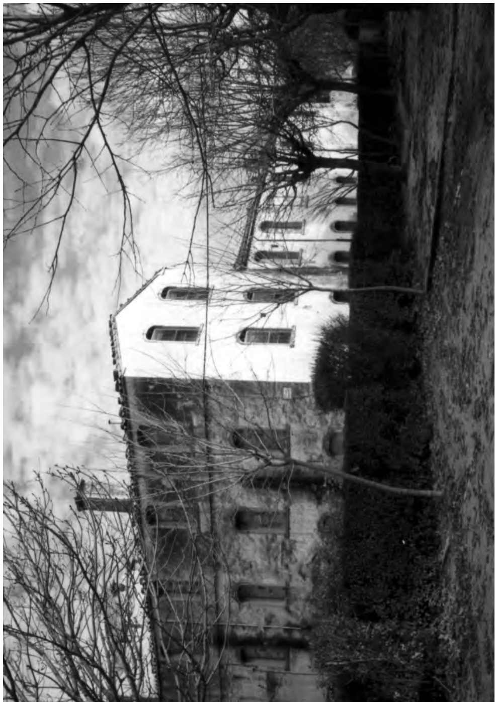
La fàbrica Hijos de Eusebio Ferrer va tancar el 1971. Aquest era l'aspecte que oferia el desembre de 1996, abans de ser enderrocada per construir l'hotel "Comtes de Queralt".