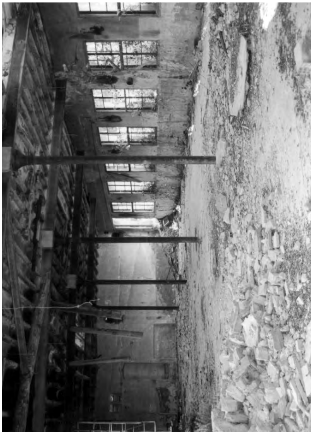
Interior de la fàbrica Ferrer Hnos. després del seu desmantellament.