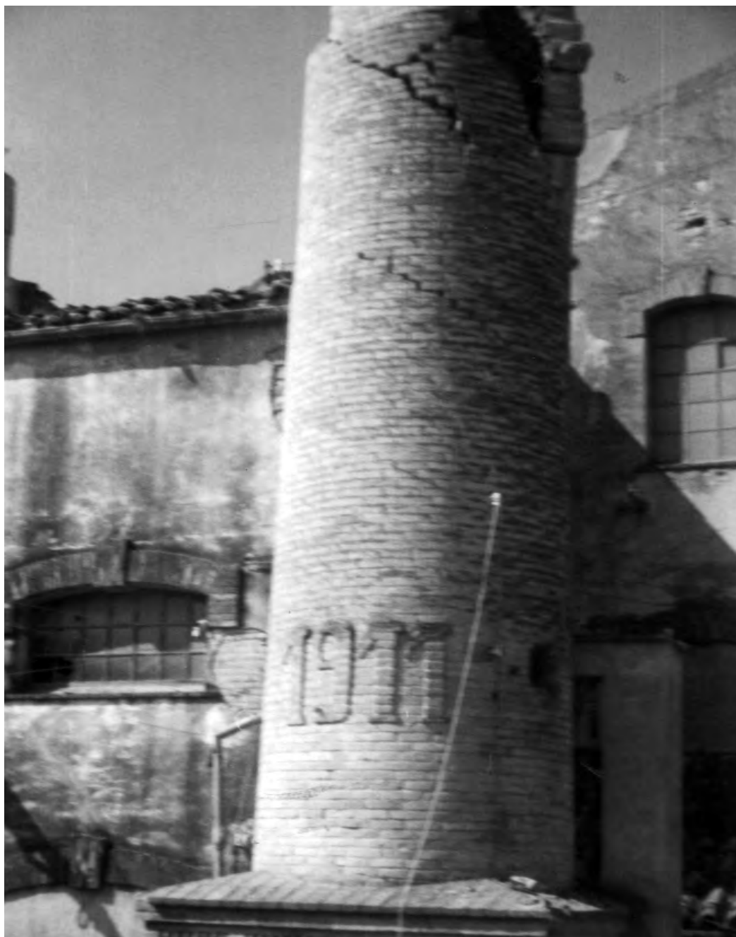
Xemeneia de la fàbrica Ferrer Hnos, enderrocada per un tornado la nit del 29 al 30 de juliol de 1982.