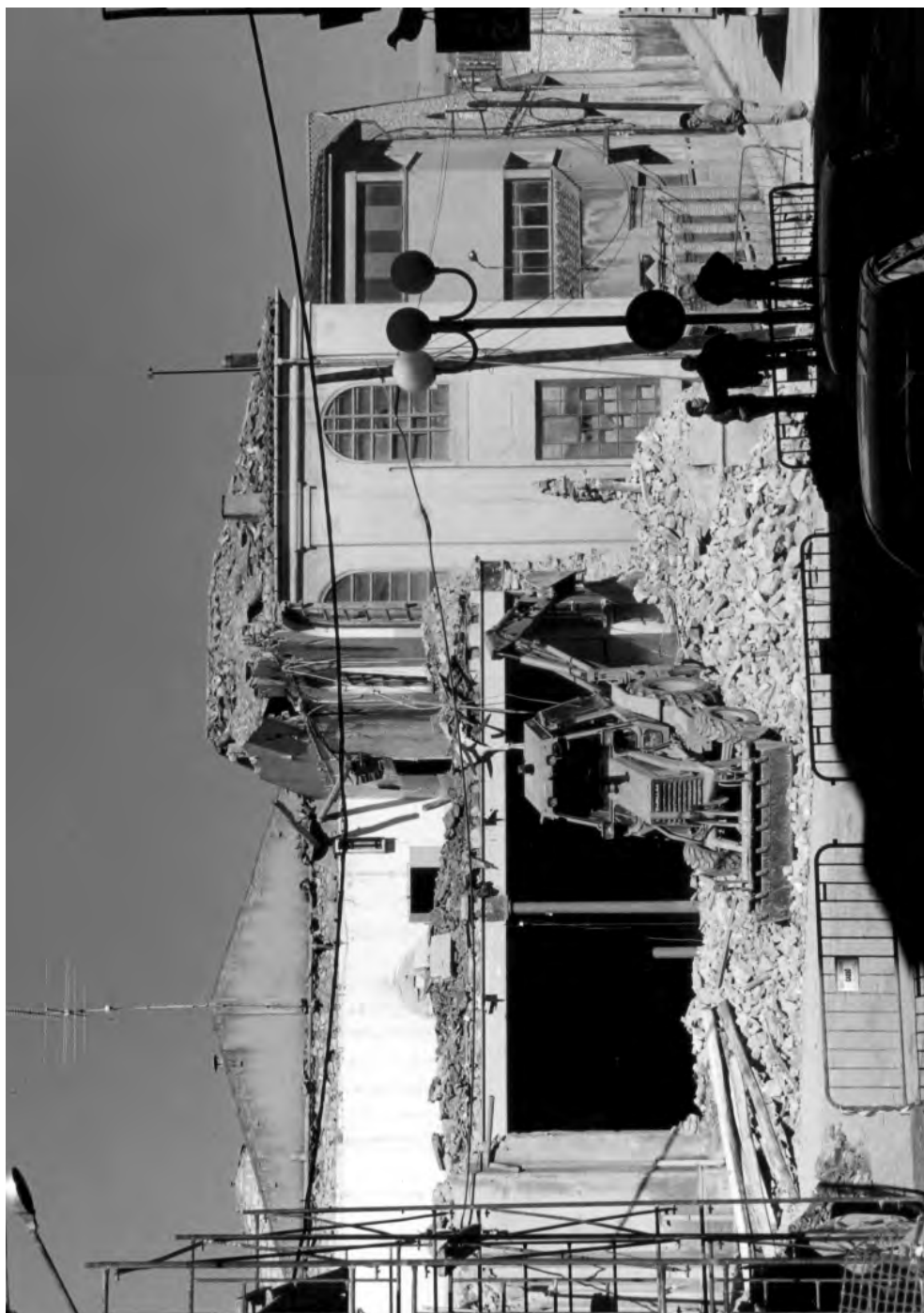
Enderrocament de la fàbrica Josep Domingo del carrer de la Plana el dia 7 d'agost de 1997.

Foto: Xavi Martínez. Any 1997. Cedida per l'autor