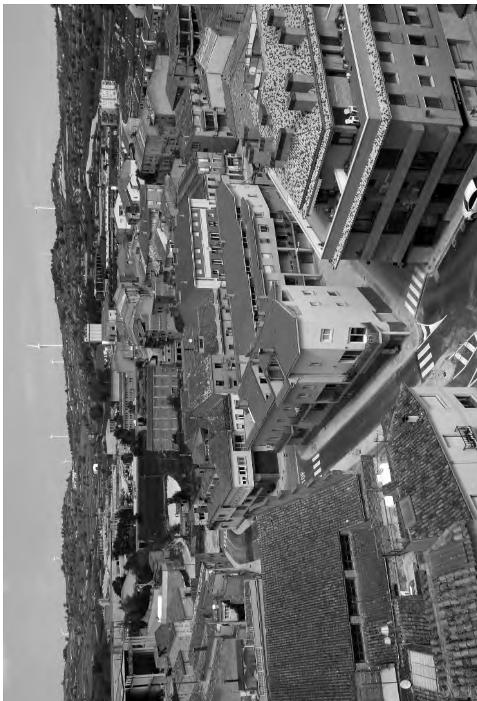
Habitatges, oficines i serveis, signes dels temps que vivim, ocupen actualment el lloc de la fàbrica de Cal Domingo que va ser la que va sobreviure més temps la crisi de la indústria tèxtil.

Foto: Silvestre Palà. Any 2010. Cedida per l'autor.