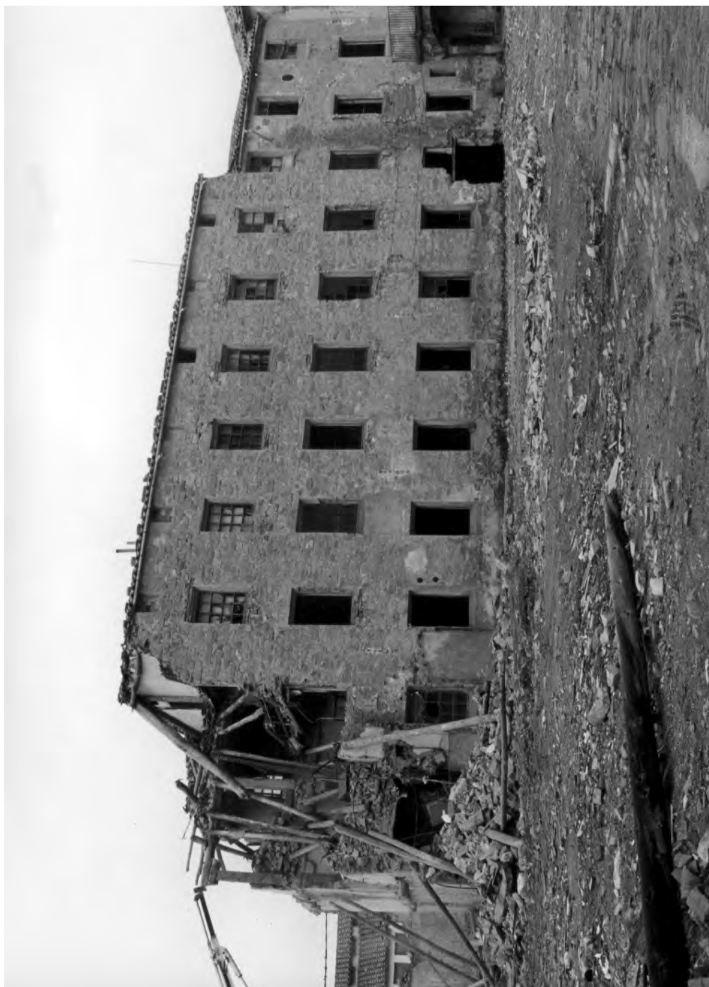
Enderrocament de la fàbrica Hijos de Eusebio Ferrer "Hort del Fèlix"

Foto: Xavi Martínez. Any 1999. Cedida per l'autor