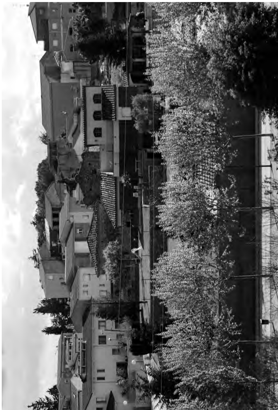
Jardins i habitatges dels descendents de la família Ferrer Combeller ocupen actualment el lloc de la fàbrica més emblemàtica que havia tingut Santa Coloma: Ferrer Germans o Fàbrica Nova.

Foto: Marçal Carreras. Any 2010. Cedida per l'autor