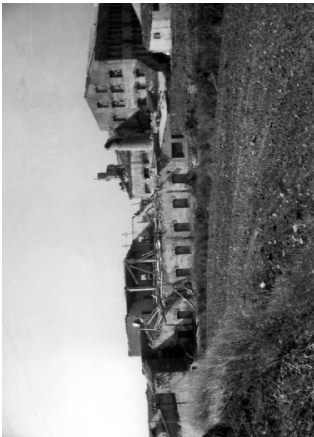
Vista general de la fàbrica Ferrer Hnos, després del pas del tornado de 1882.