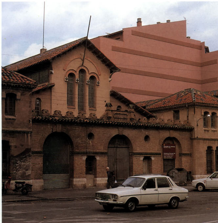
Foto 3: Els vells edificis municipals són susceptibles, moltes vegades d'una reutilització comercial innovadora

Origen, naturalesa, composició i finali-tats; additius; qualitat, quantitat, categoria o denominació usual o comercial; preu, pressupost, descomptes, despeses addicionals per serveis, etcètera; data de producció o subministrament, termini d'ús recomanat, data de caducitat; ins-truccions o indicacions per al seu correcte ús o consum.