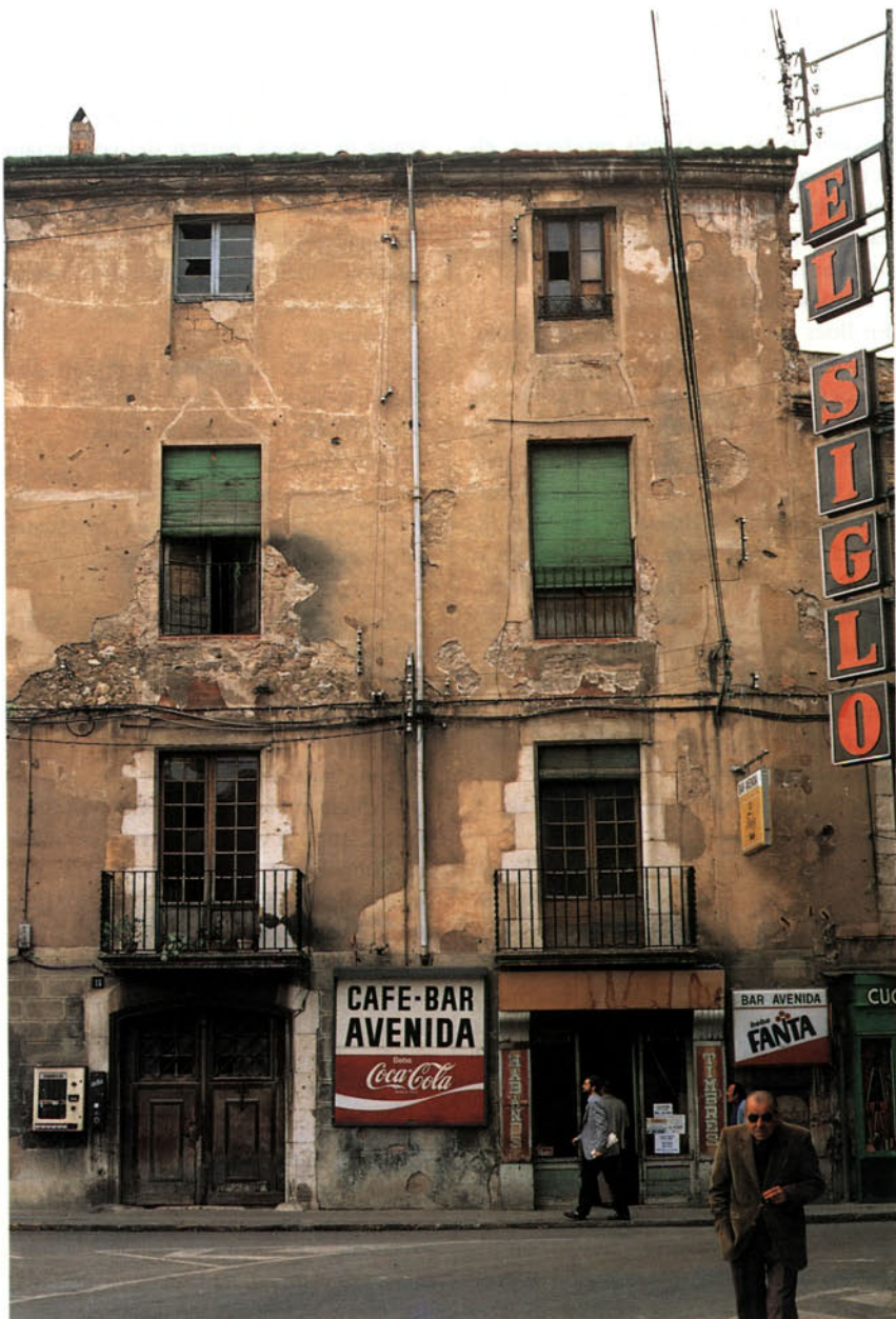
Foto 6: La renovació és una de les necessitats del comerç actual per tal de mantenir els nivells de benefici