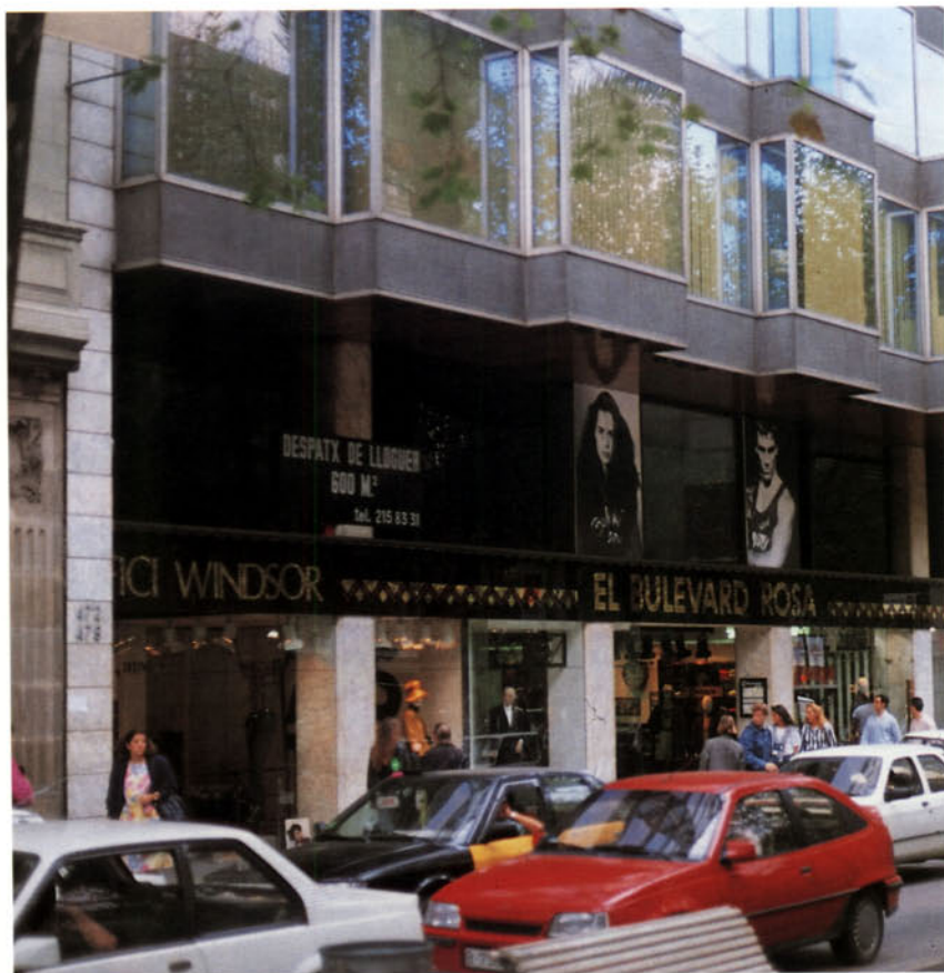
Foto 4: Les galeries comercials són una forma de comerç regulada per llei que s'estén arreu de Catalunya

L'incompliment dels requisits, condicions, obligacions o prohibicions de naturalesa sanitària; quan es produeixin riscos per a la salut i seguretat; l'adulteració o frau de béns o serveis; l'incompliment de les normes reguladores de preus; l'incompliment de les normes relatives a registre, normalització, etiquetatge, etcètera.