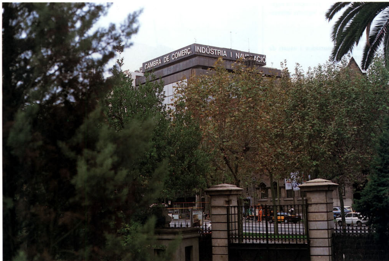
Foto 2: Les cambres de comerç són els organismes que defensen els interessos dels comerciants