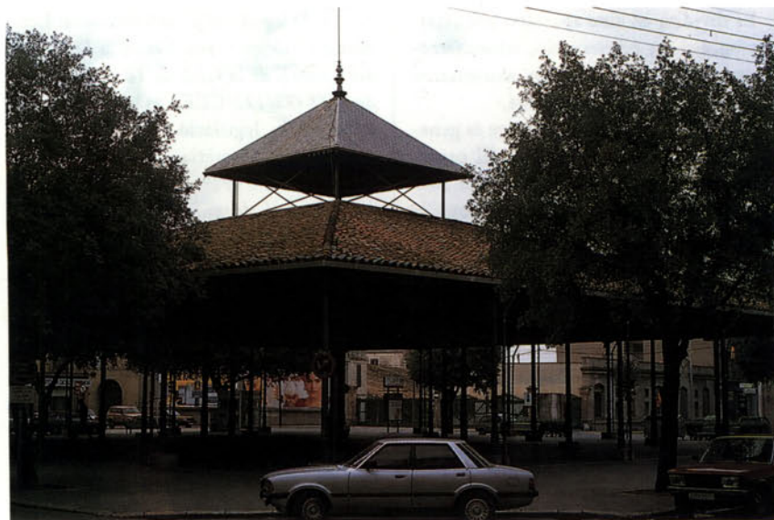
Foto 1: Estructures de ferro com aquestes, o places porxadades, han hostatjat tradicionalment el comerç quotidià de Catalunya

A nivell de l'Estat Espanyol, cal esmentar dues normatives: la primera regula l'etiquetatge dels productes, en el qual és obligat l'ús de la llengua espanyola, i fou dictada l'any 1964; l'altra és el Código Alimentario Español , aprovat l'any 1967, i encara en vigor, que és un primer intent d'ordenació del comerç ali-