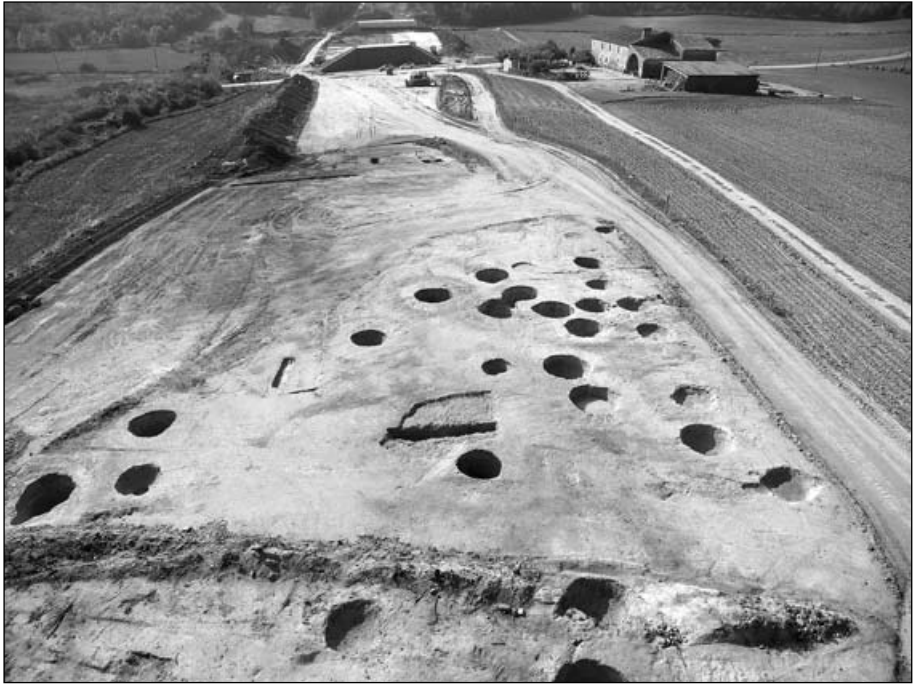
Fig. 5. El camp de sitges de l'Abadia, des del nord. Es poden veure bé el traçat del TGV i el mas de l'Abadia.