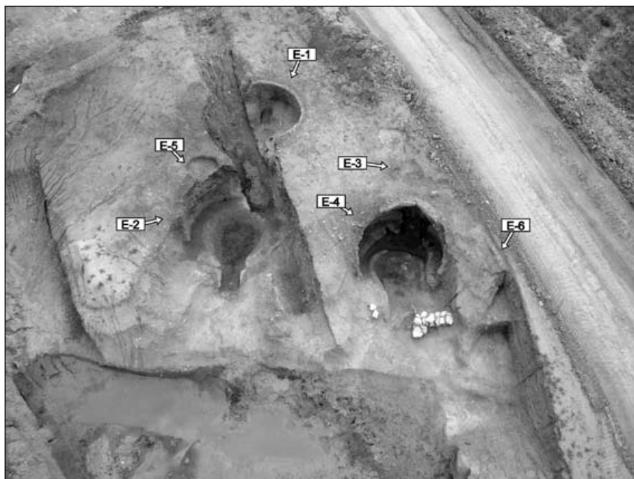
Fig. 8. Vista aèria del sector 1 amb els forns E-1 i E-2 i la cubeta E-5 a la banda esquerra i els forns E-3, E-4 i l'estructura de combustió indeterminada E-6 a la dreta.