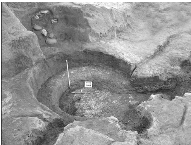
Fig. 11. Vista final de la cambra de combustió i praefurnium del forn E-7. Al marge superior esquerre es veu la boca d'alimentació, encara tapiada, del forn E-8.