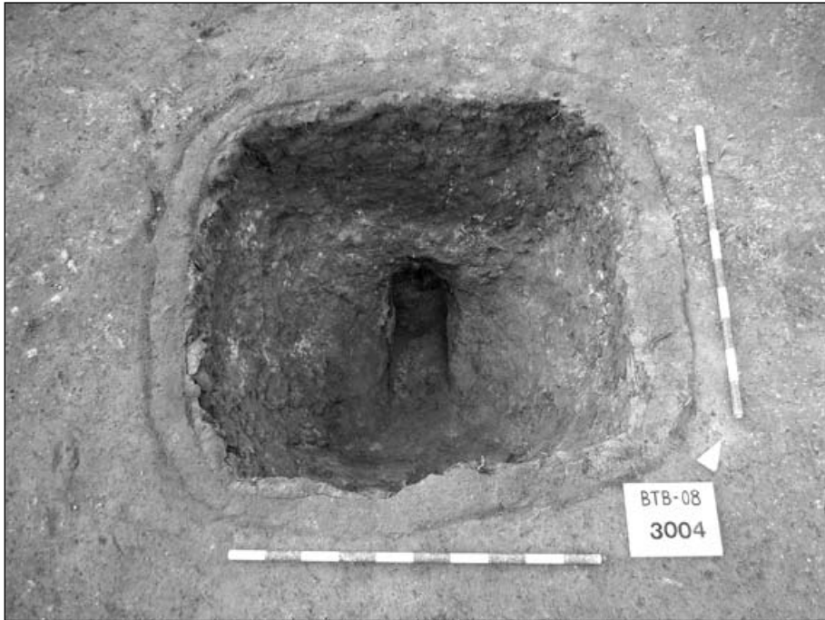
Fig. 12. Vista final del forn E-10, amb el præfurnium al fons de la cambra de foc.