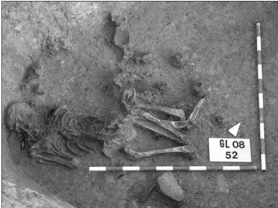
Fig. 3. L'altre enterrament de Can Gelats, amb l'esquelet de bocaterrosa, restes dels vasos d'acompanyament i la fulla d'una destral polimentada a tocar del crani.

Entre els dies 29 de setembre i 10 d'octubre de 2008 es va realitzar l'excavació arqueològica d'un altre jaciment, Camps de mas Figueres, situat a uns 150 metres