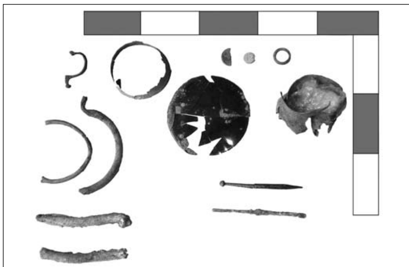
Fig. 7. Objectes metàl·lics del Camp de l'Abadia. Hi podem veure monedes, una fíbula, un braçalet, una anella, unes nanses, un mirall, una espàtula, grapes de plom i una agulla d'os treballat.