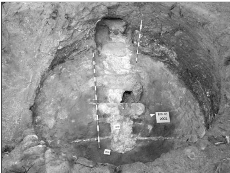
Fig. 10. Vista de la cambra de combustió del forn E-8, amb la canal i les lloses per a la recollida de cendra i farcida amb restes de calç.