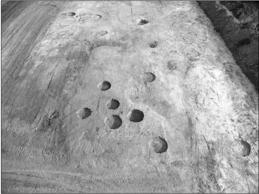
Fig. 1. Vista aèria del jaciment de Can Gelats.