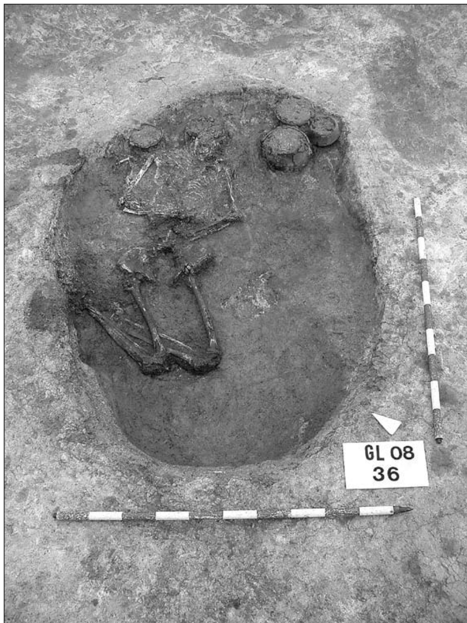
Fig. 2. Un dels enterraments neolítics de Can Gelats, amb els vasos d'acompanyament encara in situ .