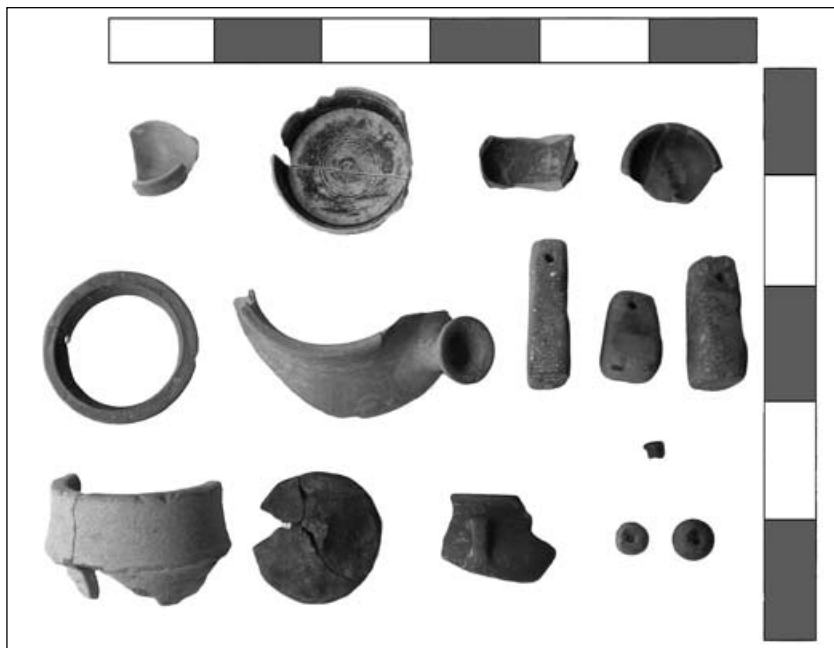
Fig. 6. Objectes ceràmics d'ús quotidià apareguts al Camp de l'Abadia. Hi ha vaixel·la de taula i de cuina, àmfores i peces de teler.