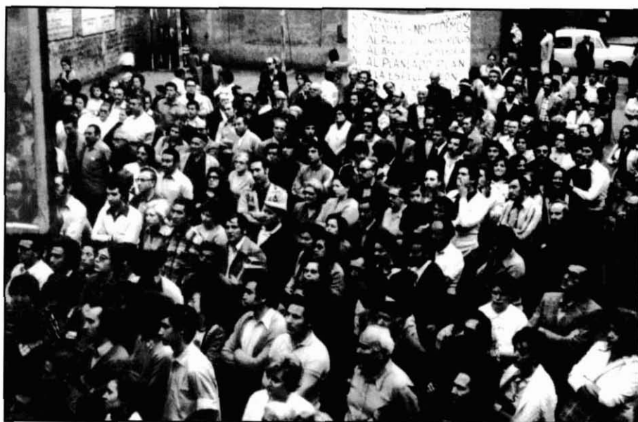
Assemblea de veïns i veïnes; lluita contra el Pla Parcial.

El 18 d’octubre de 1971, la Comissió Municipal d’Urbanisme, amb petits retocs, aprova el Pla Parcial. El Pla havia d’anar al Ministerio de la Vivienda per a la seva aprovació definitiva. El 4