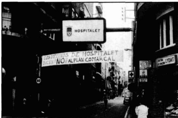
Lluita contra el Pla Parcial.