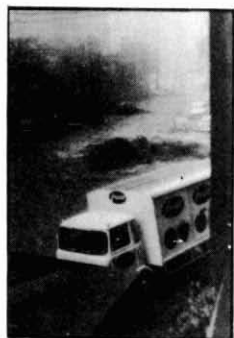
NUESTRA RIERA EN DIAS DE LLUVIA...

LA ASOCIACION COLL BLANCH-TORRASA CENTRO SOCIAL DE SANTS COMISION de VECINOS de RIERA BLANCA