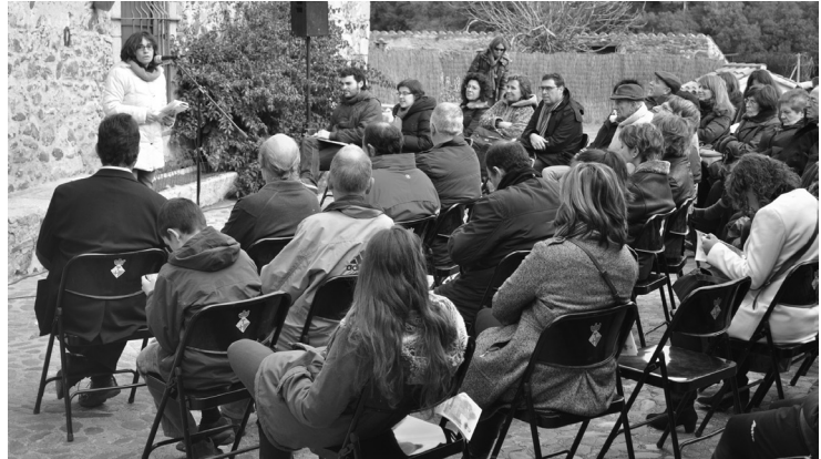
Imatge de la celebració de l'homenatge a Francesc Casas i Amigó a la masia de can Suari d'Alfou l'any 2012, amb motiu del 125è aniversari de la mort del poeta.

Va ser gràcies a aquests nuclis que l'any 1962 es va poder impulsar un primer homenatge i una reedició del recull pòstum Poesies amb motiu del 75è aniversari de la mort del poeta i, l'any 2012, com a part complementària d'aquesta investigació, una segona celebració amb motiu dels 125 anys de l'efemèride.