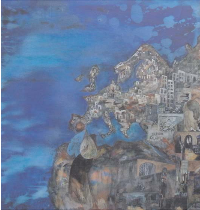
Tàpies L'home patrimoni de la humanitat Tècnica mixta sobre tela 100 x 100 cm