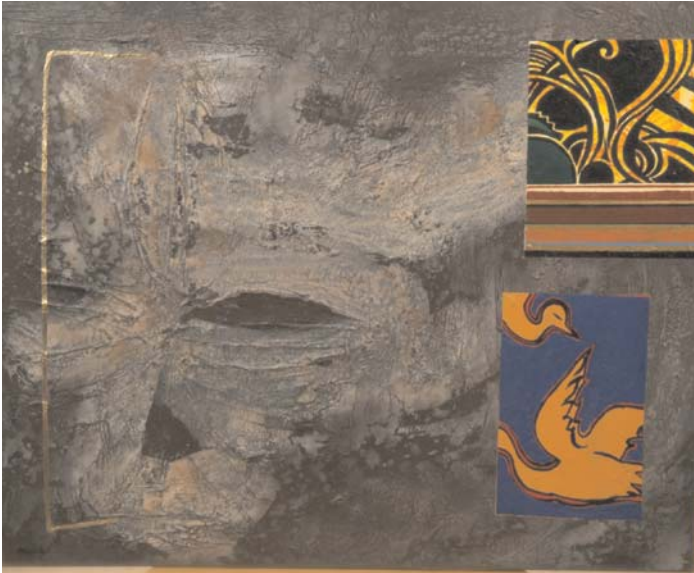
Josep Niebla Memòria d'Àfrica Acrílic sobre tela 60 x 73 cm