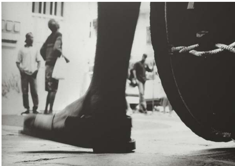
Ananias Leki sense títol Fotografia 38 x 56 cm