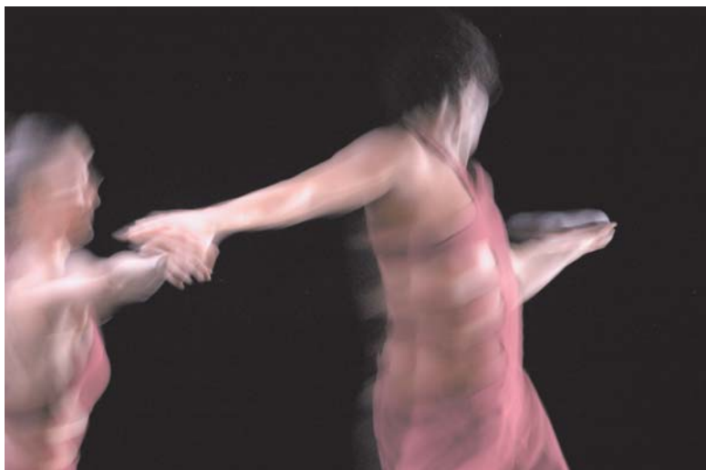
Martí Artalejo Cohesionat Fotografia digital 80 x 120 cm