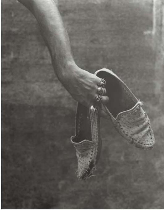
Albert Garcia Autoretrato con zapatos Fotografía 50 x 40 cm