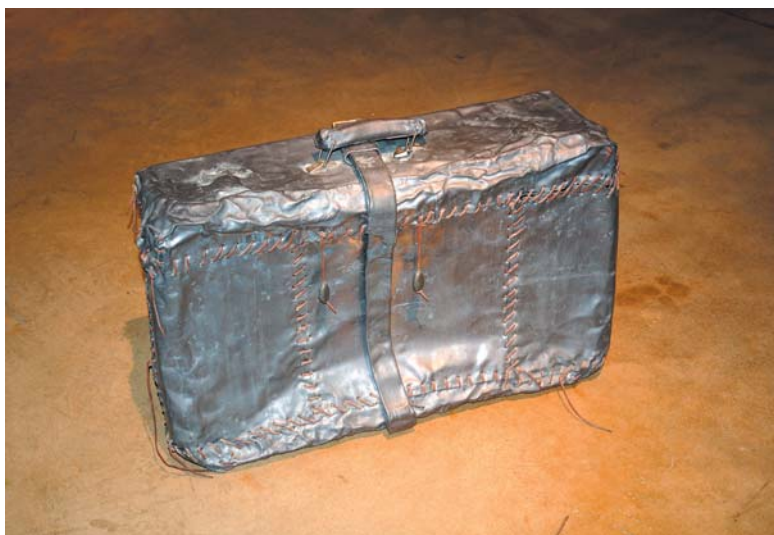
Mario Pasqualotto sense títol Escultura de plom i fil d'acer 45 x 73 x 21 cm