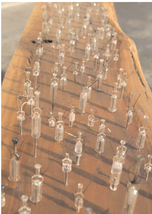
Joan Viñas Manifestació Tècnica mixta de fusta, ferro, vidre i terra 360 x 82 x 37 cm