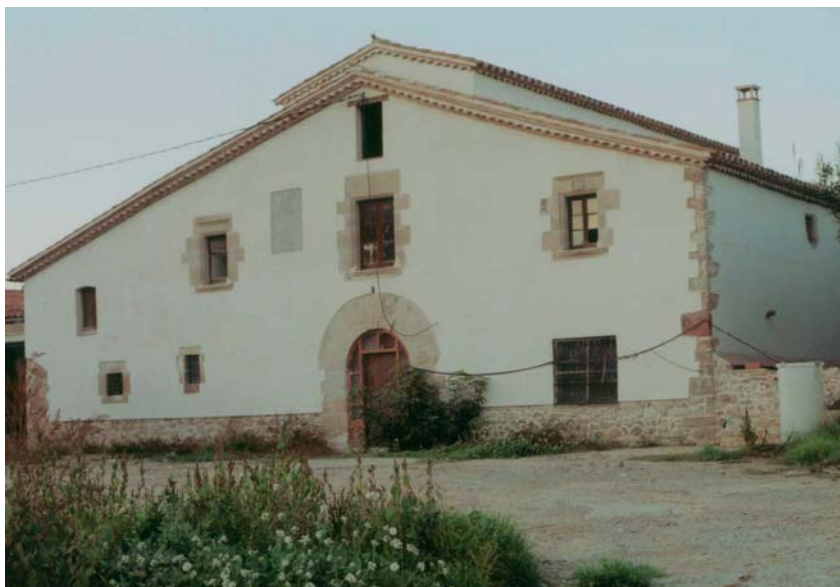
La masia de can Vila-rosal en l'actualitat.

La casa pairal, encara dempeus, està documentada per primer cop l'any 878, i descrita en el llistat de jaciments d'època ibèrica i medieval del museu de Granollers, com a vila romana. És, doncs, una de les més antigues de la comarca. Es troba situada en territori del municipi de Parets del Vallès, dins del terme de Lliçà de Vall i amb accés pel camí de Palaudàries, des de la carretera Granollers-Sabadell. Els anys noranta va patir un greu deteriorament, esmenat per la rehabilitació que s'ha dut a terme els darrers anys. La importància de la propietat es fa palesa en l'extensió del territori, que el 1827 era de 77 quarteres, equivalents a una superfície de 2.939 àrees i abastava el bosc, l'era, la vinya i la masia. Està orientada a migdia, i construïda amb l'arquitectura de la típica masia catalana d'àmbit rural 4 .