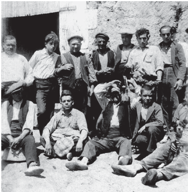
Grup de treballadors dinant, en la celebració de la fi de les obres de construcció de les caves.