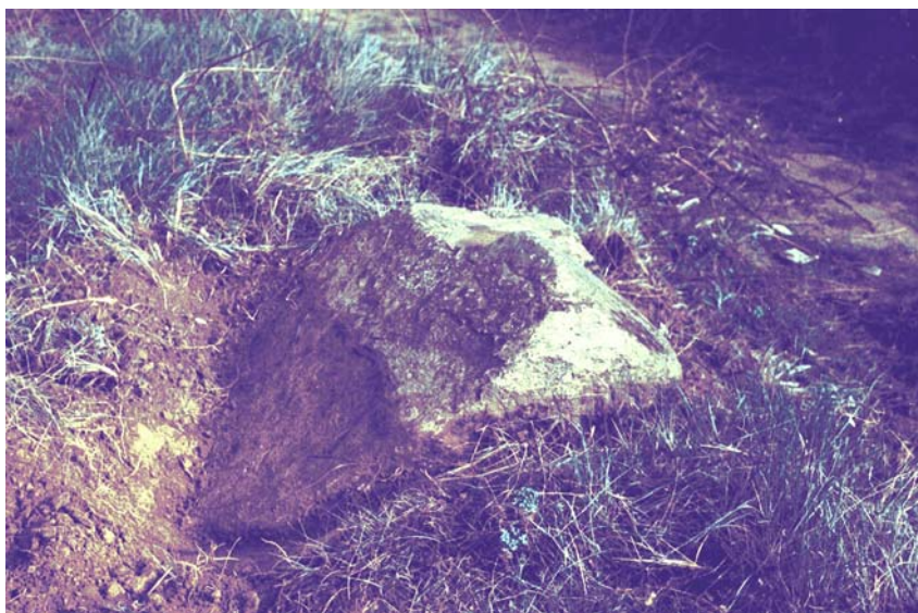
Fotografia antiga que mostra un dels fragments grans de la pedra estavellada al marge de la vinya, al costat del camí (Pau Ros Fontseré, 9-3-1975). També a peu de pàgina ens diu les mides: “Té 2,30 m de longitud per 1,90 de latitud”. 10

Per tant, en Plantada en tot moment parla d'un dolmen, el mateix que en Maspons y Labrós, que, en un article de 1882, amb un llenguatge molt literari de l'època, diu: “... altre monument hi volgué aixecar é hi deixa un nou dolmen. En aquell turó queda encara, allí es, ajeguda a terra i mitj colgada, la taula o pedra plana que l' formava. Los sustentàculs, dos no més, los altres qui sap on paran, son per allí al voltant l'un al peu metéix de la pedra y l'altre un xich més enllanet, a vora del camí que hi porta.”