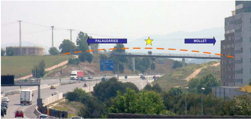
Reconstrucció del perfil del turó de la Pedra Salvadora (Antoni Duran 2006).

diferents camps), i el propi bosc de Can Pantiquet (reduït i abandonat, però encara existent).