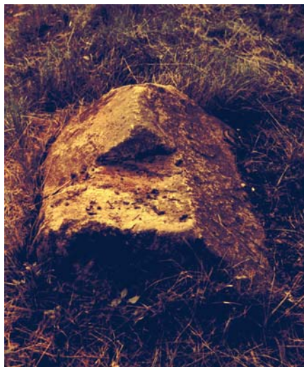
Fotografia de la Pedra Salvadora presa des del nord (Pau Ros Fontseré, 9-3-1975).

Però una raó més realista ens fou explicada per l'Andreu de Can Rigalt. La Pedra estava a dalt del turó, al costat del camí de Palaudàries. Als carros, els costava força pujar el tros fins a dalt de la carena. Molts cops s'havien de deixar els cavalls uns traguiners als altres per tal d'arribar-hi. Per això, un cop al punt més alt, on hi havia la Pedra, deien que ja estaven salvats i podien continuar el camí.