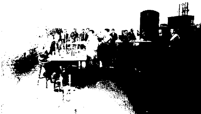
Curs a l'Estació Enològica de Vilafranca (Arxiu Museu de Vilafranca).