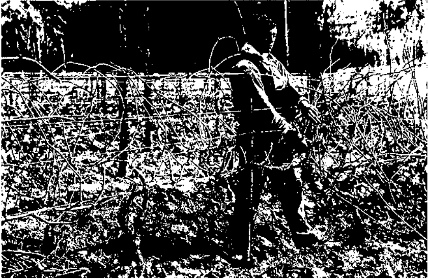
Vinya emparrada a Can Codorniu (Arxiu Codorniu).