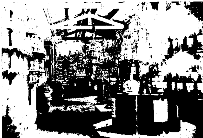
Fira Regional de Vilanova de 1882.