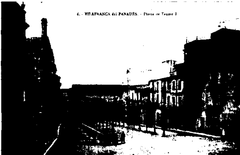
6. - VILAFRANCA del PENEDÈS. - Plaça de Jaume I

Al novembre, la pujada al poder de Canalejas significà una dura repressió sobre el moviment obrer, i tant la FLO com les societats obreres vilafranquines foren clausurades i dissoltes, la qual cosa deixà, d'aquesta manera, els treballadors indefensos. Als treballadors, no els restà altra alternativa que tornar a la feina, tot i que molts aconseguiren que se'ls respectessin els drets i millores aconseguits abans de la vaga. El 13 de gener de 1912 sortia de la presó l'obrer que restava engarjolat, sota una fiança de 1.000 pessetes.