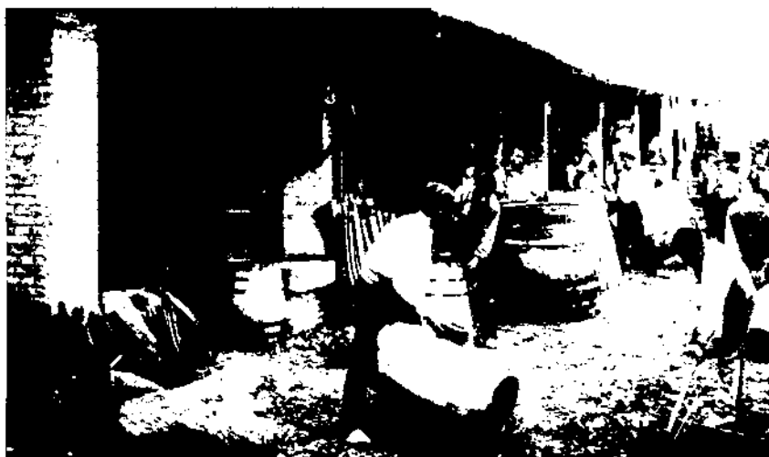
La important societat dels boters va prendre actituds, a les darreries del conflicte, en desacord amb les altres societats obreres.