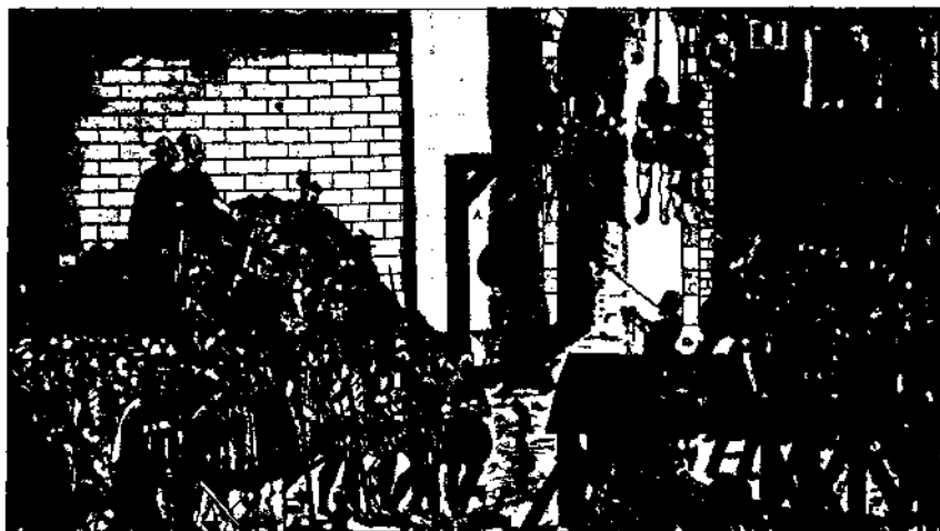
Execucions d'hugonots o calvinistes francesos a Amboise el 1560 segons un gravat del segle XVII.

conseqüents fugides de la croada contra els càtars o albigesos de les darreries del segle XII i primer terç del segle XIII; la guerra contra els protestants, dits hugonots , de les darreries del segle XV i començaments del segle XVI i finalment la lluita entre revolucionaris i contra-revolucionaris del 1791 al 1794.