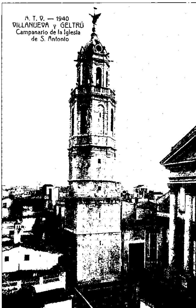
En el lloc avui ocupat pel campanar de Vilanova es va establir un cementiri a part dels luterans que no podien rebre sepultura en terra santa.