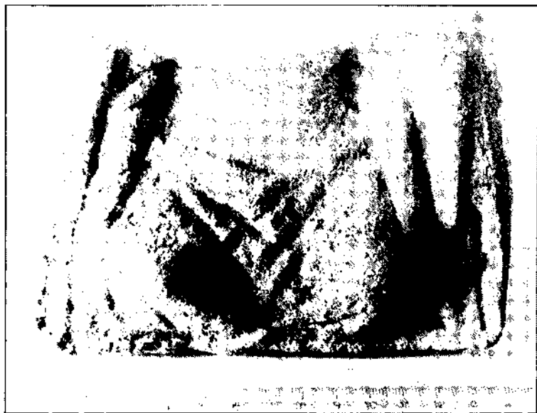
Fig. 2 · Placa arquitectònica.

Una altra possibilitat, també hipotètica, és que fos una estela funerària d'alguna indígena. Diem indígena perquè el fet que porti trenes fa la impressió d'una dona germànica, ja que la dona romana no utilitzava aquest tipus de pentinat. L'únic problema és que la peça sembla de factura romana, i ens ho