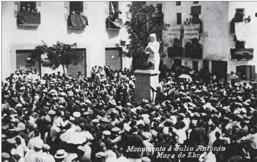
Fig. 4. Fotografia de la inauguració del monument dedicat a Julio Antonio a la plaça de Dalt, obra de Santiago Costa

Per a Móra d'Ebre, la commemoració esmentada fou un esdeveniment només comparable al que hi va tenir lloc l'any 1929 (feia 10 anys que el gran escultor havia mort a Madrid) amb motiu de la inauguració del monument que se li dedicà al bell mig de la plaça de Dalt, on continua. És obra de l'escultor Santiago Costa, fill de la mateixa vila. Per cert que la iniciativa d'erigir-lo —amb els cabals d'una subscripció popular— sorgí de la redacció de la revista