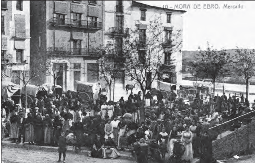
Fig. 3. Fotografia del mercat que se celebrava a la plaça de Baix als inicis del segle XX

doncs, aquella aflluència de forasters (de Móra la Nova, però, no gaires car ja hem dit que les dues poblacions estaven de punta), aquella gernació inusitada? L'explicació surt d'un fet i és que Móra d'Ebre, vila de quatre mil ànimes, oferia, al marge de la fira, certs atractius menys innocents i de més consistència. Així, mentre els petits i les petites, agafats de la mà del pare, de la mare o de la germana gran, badaven en el clos de les barraques o pujaven als cavallets, els joves de quinze o setze anys, altres de més granats i fins homes declaradament madurs, entraven d'amagatotis a Can Llesca, o al cafè del Pinella, on podien pessigar les anques de les cambres o jugar al monte, si això els feia més gràcia. Al monte, sovint, no l'encertaven, però a l'altre joc l'encertaven sempre. (Són coses que vaig anar sabent amb el pas dels anys.) A part d'això, la gent anava a Móra a berenar. No fer-ho hauria estat un mancament als costums establerts, un sacrilegi gairebé. Els petits menjaven, per regla general, torrons de Xerta (de mel i avellana) i bevien gasoses (o gracioses , com diuen allí). En aquell temps les gasoses morenques d'una determinada casa passaven per ser les millors del món i llur bondat pervenia, segons deien, d'un secret que passava de pares a fills. A Móra se'n gloriejaven i parlaven de les famoses gracioses com a Sant Sadurní deuen parlar del xampany.