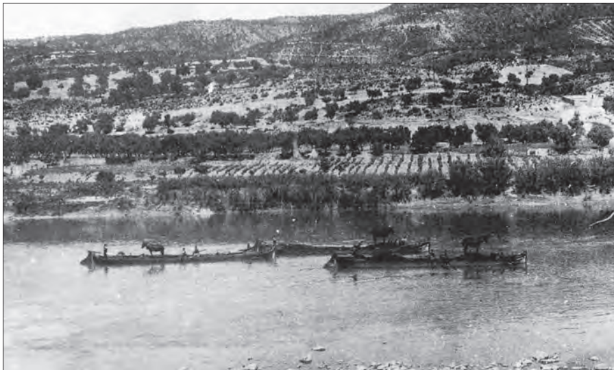
Fig. 1. Tres llaiüts Ebre avall, amb la càrrega i l'animal, als inicis del segle XX

Móra d'Ebre s'assenta, no pas gaire planament, en el flanc d'un ample turó que surt de la mateixa riba. Després de Reus, és la població més important de Catalunya en el comerç de l'ametlla. Centralitza i esclofolla no solament les de la comarca, sinó de la Terra Alta, del Priorat, de les Garrigues... En el comerç de l'alcohol i de l'oli, és digna també de consideració. Té molins d'oli, fàbriques de sabons, manufactures de mobles. És pàtria de bons escultors i, entre aquests, de Carles Mani, col·laborador de Gaudí en les obres del temple de la Sagrada Família. Morenc és així mateix Feliu Ferrer, autor del monument que Tarragona alça a Roger de Llúria; i de Móra d'Ebre és Julio Antonio, notable entre els grans. Sembla que és el fang de l'Ebre amb el qual els nois s'exerciten a modelar figures, l'element que cal posar a l'inici de la vocació per l'art plàstica per excel·lència.