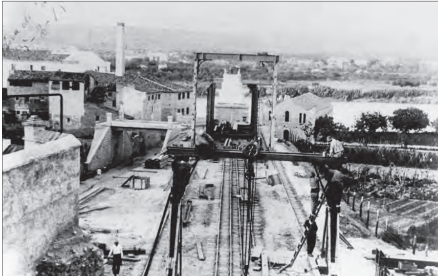
Fig. 5. Fotografia dels treballs de construcció del pont de Móra