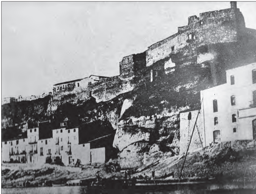
Fig. 4. El castell de Móra des del riu a principis del segle XX

Castell i muralla protegien la zona urbana (vila closa). La muralla s'estenia pels actuals carrers Nou, de Santa Madrona, del Doctor Peris, i per les escales es dirigia cap a la plaça de Sant Roc. Per l'altra banda, del carrer de la Barca i de la plaça, el mateix riu els feia de frontera.