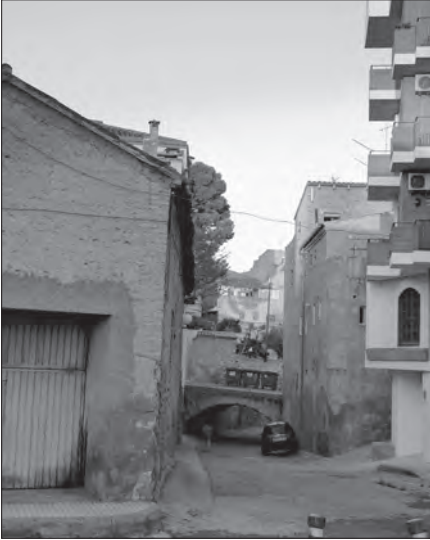
Fig 1. Barranc de Faneca