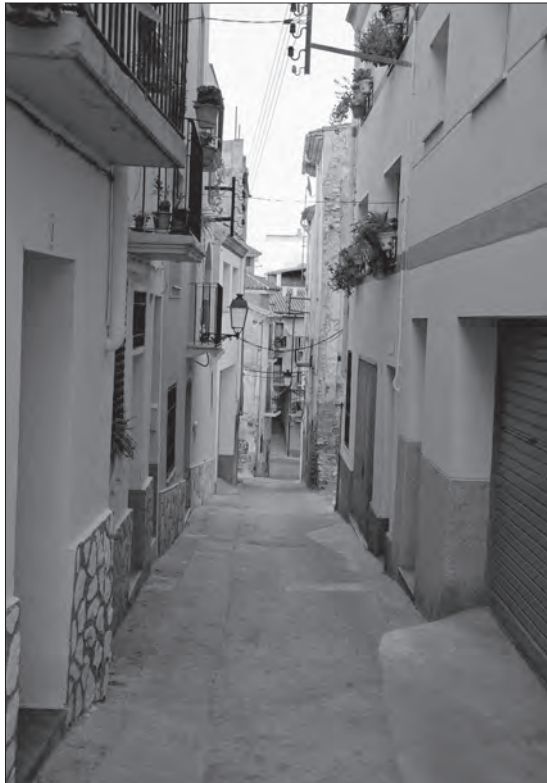
Fig. 3. Carrer del Verger i de Sant Gregori