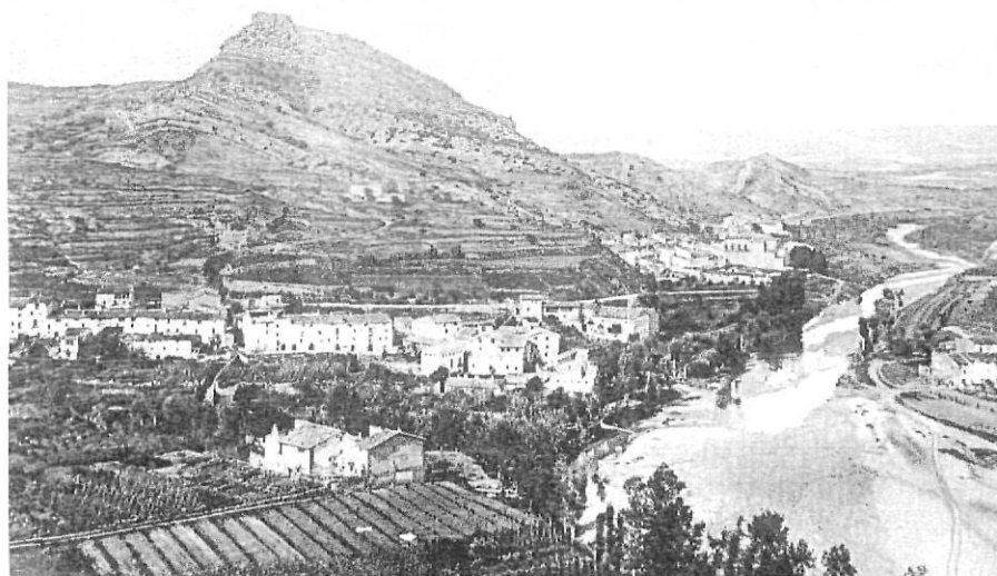
1920. El nucli de la Pobla i el barri de les Figueres, amb la vall del riu Anoia sense cap pont