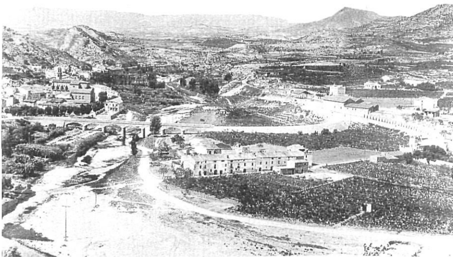
1930. La Pobla de Claramunt i els barris de les Cases Noves i de l'Estació, amb el nou pont damunt del riu Anoia