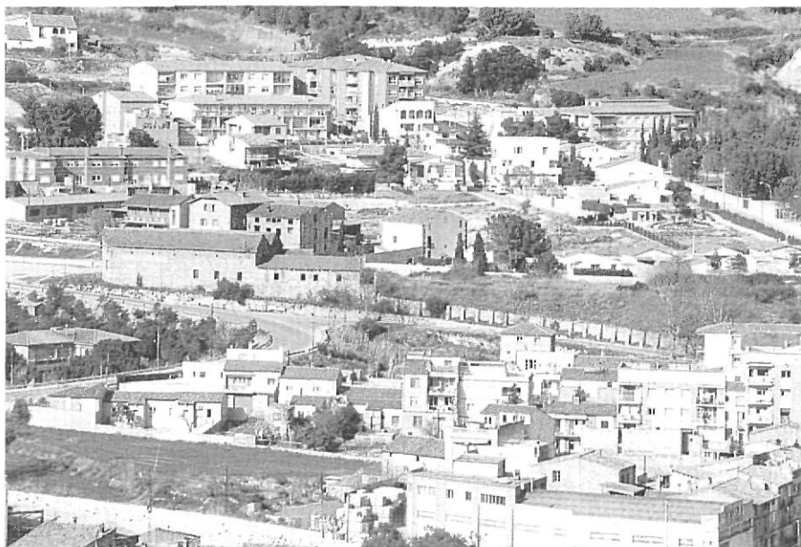
1990. Els barris de les Cases Noves i de l'Estació amb concentracions urbanes noves i blocs d'habitatges.