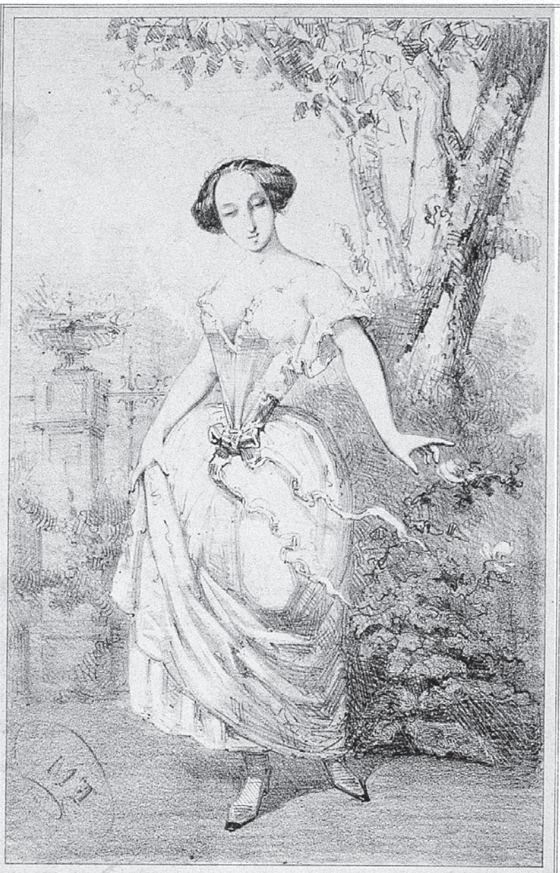
Figura 9 Marià Fortuny, El mendigo hipócrita (1857). Una de les úniques onze il·lustracions litogràfiques que féu el pintor al llarg de la seva vida. Museu Frederic Marès, Barcelona.

També F. CALLICÓ, Litografies de M. Fortuny adolescent , Barcelona, 1938, on reproduïx les litografies a petit format.