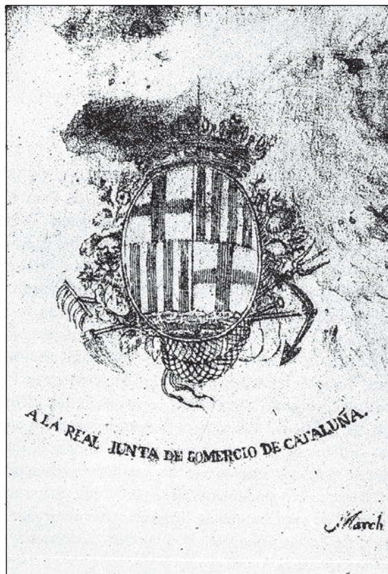
Figura 2. Josep March. Escut de la Reial Junta de Comerç de Catalunya , 1815, la litografia més antiga de tot l'Estat espanyol. Unitat Gràfica de la Biblioteca de Catalunya, Barcelona.

22. R. M. SUBIRANA, op. cit. p. 31-38, recull amb detall tot aquest conflicte.