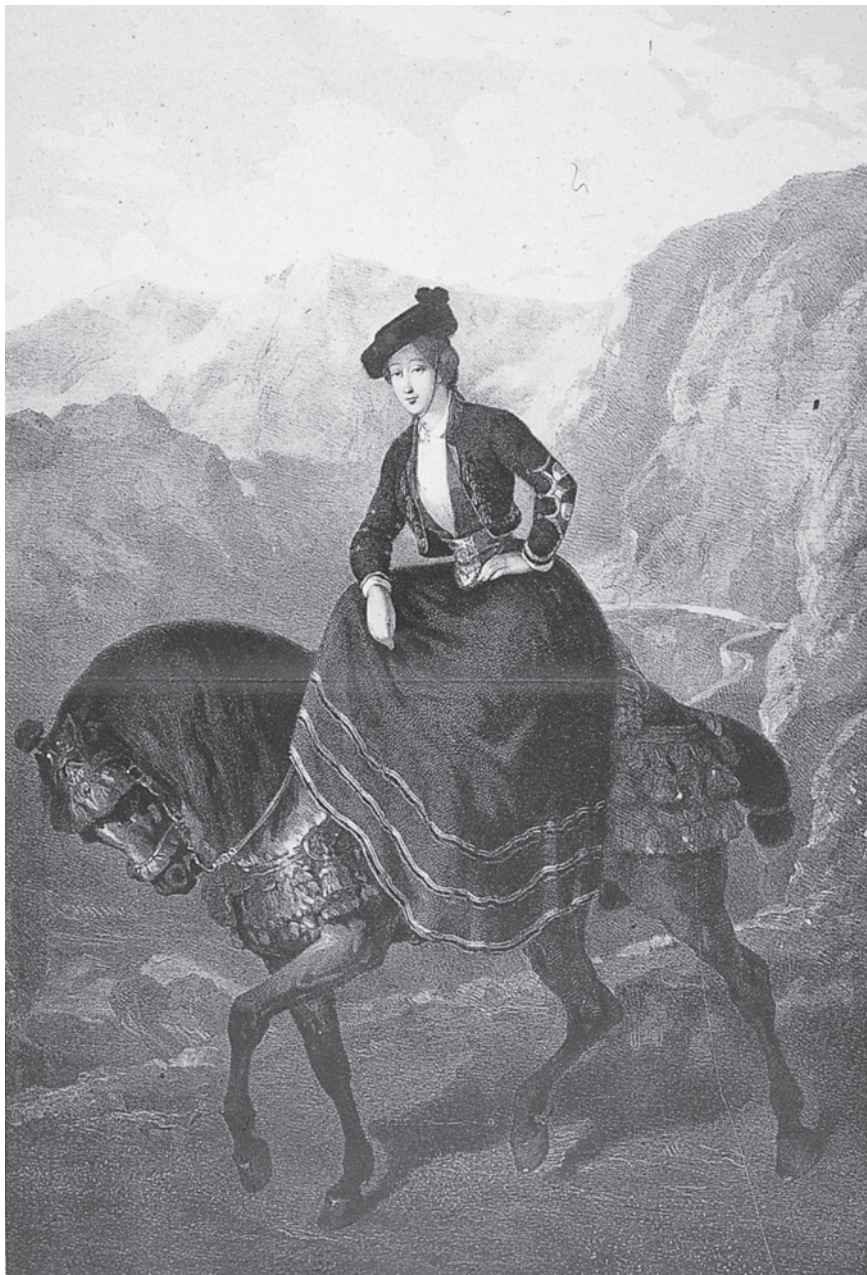
Figura 8 Eusebi Planas, La comtessa de Montijo . Primer treball litogràfic original que féu Planas a París per encàrrec de la casa Goupil, amb el qual obtingué un notable èxit.

Però, de fet, no és entre l'obra editada el 1855 esmentada més amunt i el 1865 quan Eusebi Planas realitzà moltes litografies per a nombroses novel·les 83 . I no sols Planas, que fou veritablement el dibuixant més prolífic al servei de la il·lustració, sinó també noms tan rellevants com Marià Fortuny feren alguna litografia en algun moment. És el cas de les onze al llapis gras que aquest darrer féu per a