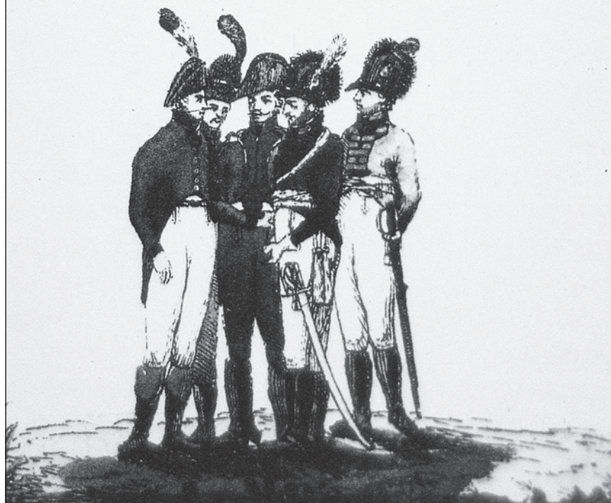
Figura 1. Pàgina litografiada del Manual del soldado español en Alemania , opuscle realitzat a Munic el 1807 per Gimbernat i Senefelder. Biblioteca de la Real Academia de la Historia, Madrid.

LAS ARMAS ESPAÑOLAS PACIFICARON LA ALEMANIA CON SUS VICTORIAS, DE TORGAO, EN 1547. DE NORDLINGUE, EN 1634; Y LA DEFENDIERON, EN SUS COSTAS SEPTENTRIONALES, EN 1807.