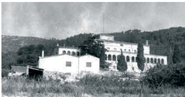
Can Castells (Esparreguera, 1934)

Sembla que fou llavors quan el pare Ambrós optà per deixar el monestir i anar a Can Castells, un mas que la comunitat tenia a prop d'Esparreguera en el qual vivia un grupet de monjos i on es fabricava el famós Aromes de Montserrat, pensant que la fugida des d'allà, si es donava el cas, seria més fàcil.