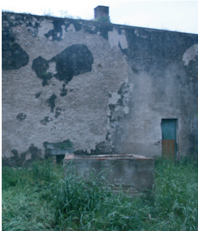
Possible ubicació del pou del glaç