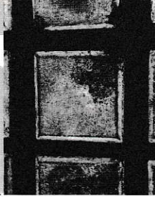
La il·lustració de la coberta és una composició de Lucas Trapaza Cojo basada en una foto de Roser Sans Fortuny