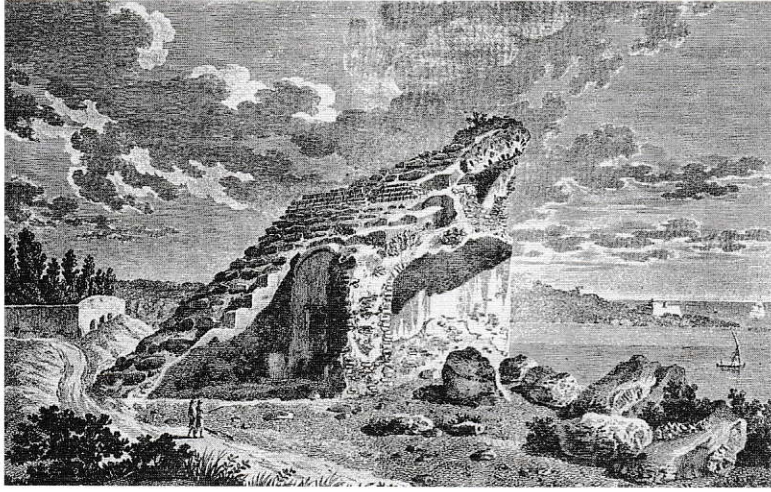
La graderia meridional de l'amfiteatre al començament del segle XIX, segons una làmina publicada per A. de Laborde en el Voyage pittoresque et historique (1806).