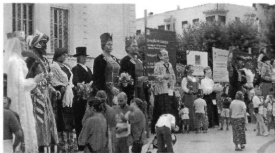
Gegants participants a la XXV Trobada