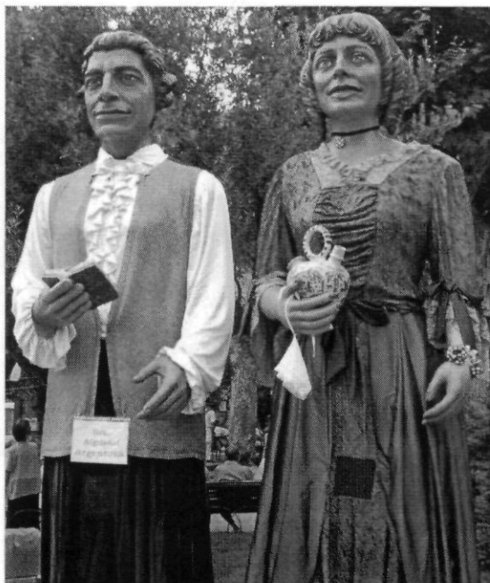
Els senyors de l'aiguanaf.