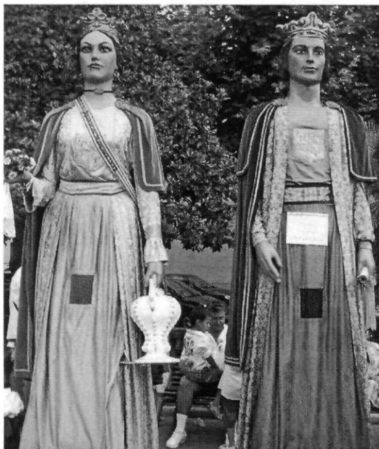
Els senyors de Burriac