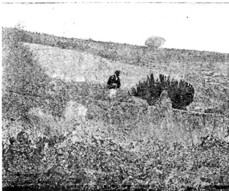
Mur de la carretera romana de Parpers

La carretera romana, transformada en mal camí, més que per la inexorable acció del temps, per l'abandono en què la deixaren segles