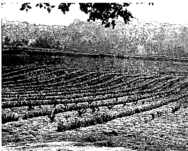
Vinya del pla de can Cabanyes, març de 1986. Una de les darreres vinyes del poble

plegar de la feina el migdia del dissabte i no tornar-hi fins al dilluns, perquè en aquells temps els rabassaires i pagesos en general treballaven sis dies i mig a la setmana; és a dir, de dilluns a dissabte tot el dia i el diumenge al matí fins a l'hora de dinar, que tant podien ser les dotze com les tres de la tarda.