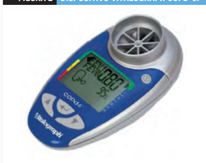
FIGURA 2 DISPOSITIVO VITALOGRAPH COPD-6.

Son tres los mecanismos mediante los cuales actuaría el TSN. En primer lugar, su uso reduciría el síndrome de abstinencia nicotínico y, en segundo lugar, reduciría los efectos reforzadores de los cigarrillos. Produce un efecto disociativo al separar la administración de nicotina del uso del tabaco. Actualmente, con la mejora del conocimiento de las