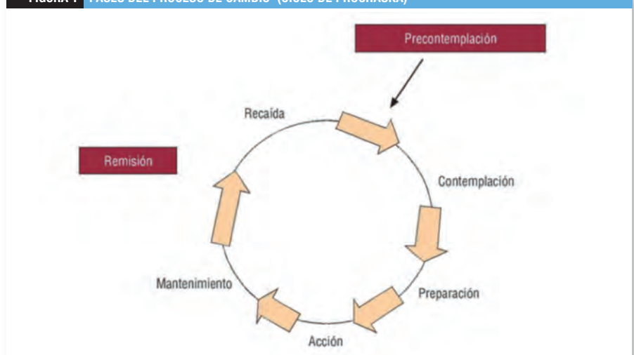
FIGURA 1 FASES DEL PROCESO DE CAMBIO (CICLO DE PROCHASKA)

La lucha contra el tabaquismo requiere, sin duda, de políticas públicas de prevención y control. El farmacéutico comunitario debería tratar de colaborar tanto en su diseño como en su puesta en práctica. Ello no es óbice para que desde la farmacia comunitaria se adopten estrategias específicas, tanto individuales como colectivas. Desde el punto de vista profesional del farmacéutico comunitario, ante el tabaquismo no cabe otro planteamiento básico inicial que el de considerarlo como un trastorno adictivo crónico. Para su abordaje es necesario que el farmacéutico adopte una actitud proactiva, preparándose para adelantarse