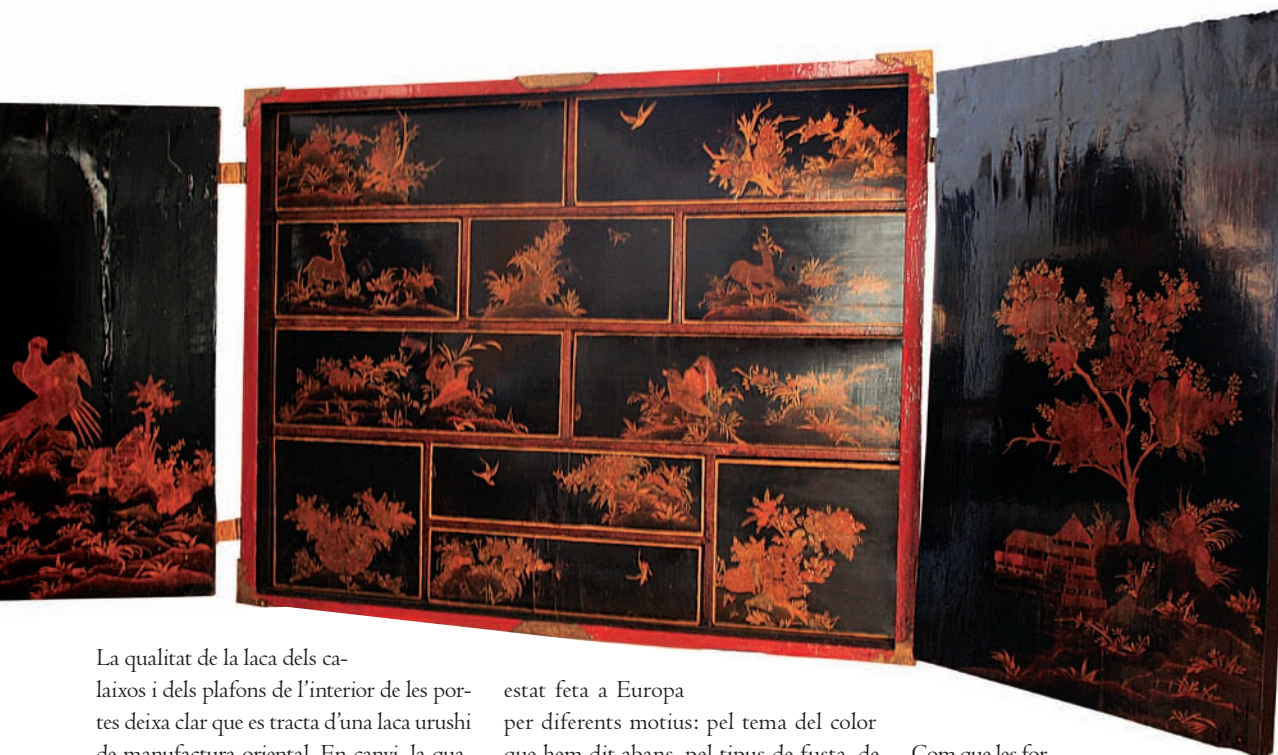
Aspecte de l'escriptori després de la restauració. S'aprecia el dibuix en tota la seva composició.

La qualitat de la laca dels calaixos i dels plafons de l'interior de les portes deixa clar que es tracta d'una laca urushi de manufactura oriental. En canvi, la qualitat de la laca dels plafons de l'exterior és molt inferior. Podria tractar-se de plafons pintats a Europa a l'estil oriental, amb llaques poc refinades.