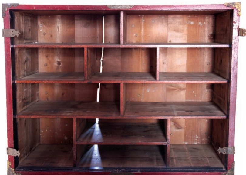
Aspecte que oferiria l'estructura de l'escriptori abans de la restauració.

El resultat final és una peça en què s'ha retocat mínimament el dibuix original, evitant inventar els perfils i on la capa pictòrica ha quedat totalment consolidada i protegida. ■