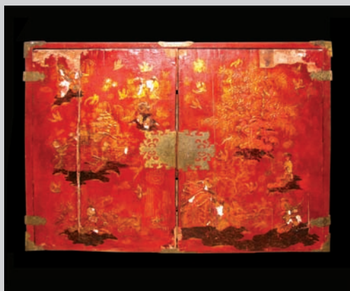
1. Abans de la restauració s'aprecien les pèrdues del suport i de la capa pictòrica.