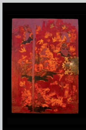
2. El material que es va fer servir per a la reintegració deriva de la laca.