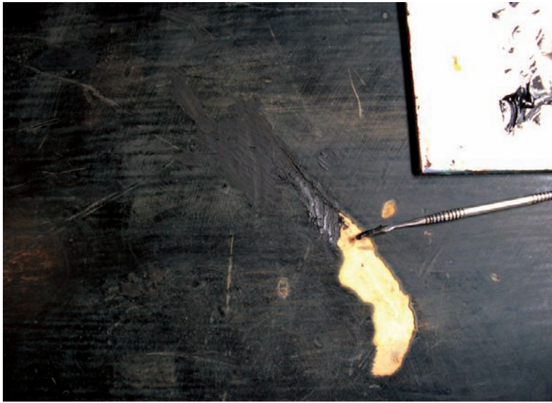
En el lacat interior negre, tant la reintegració volumètrica com la pictòrica es va fer amb laca urushi.