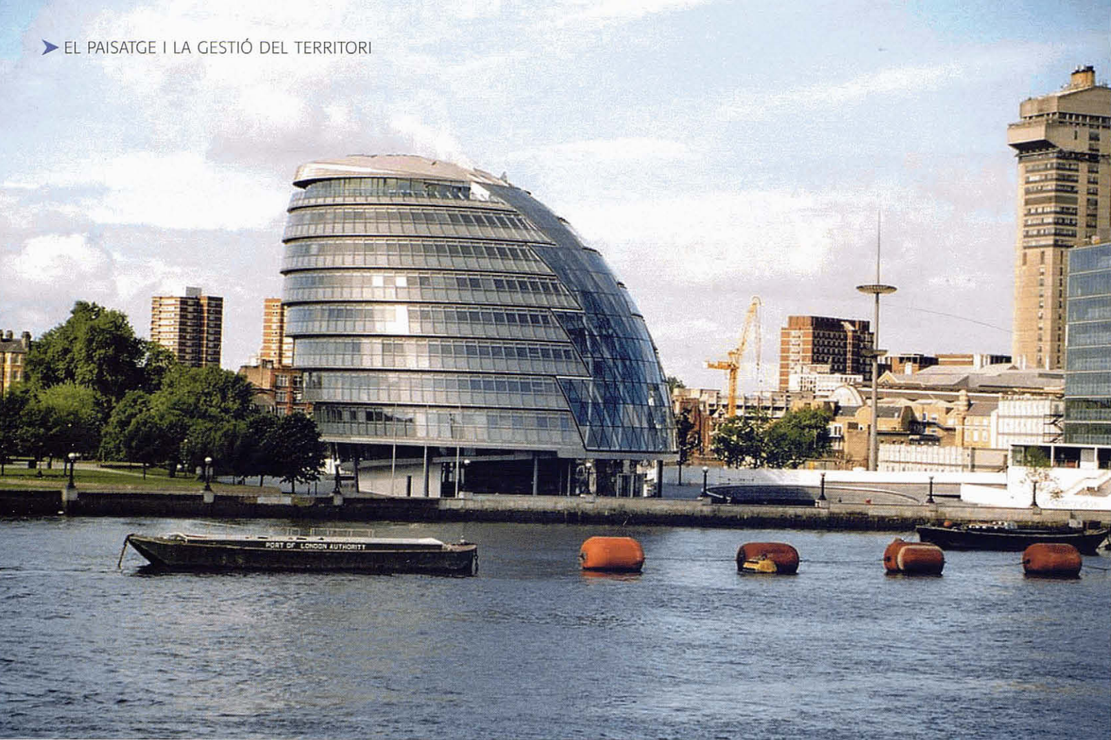
Londres des del riu.