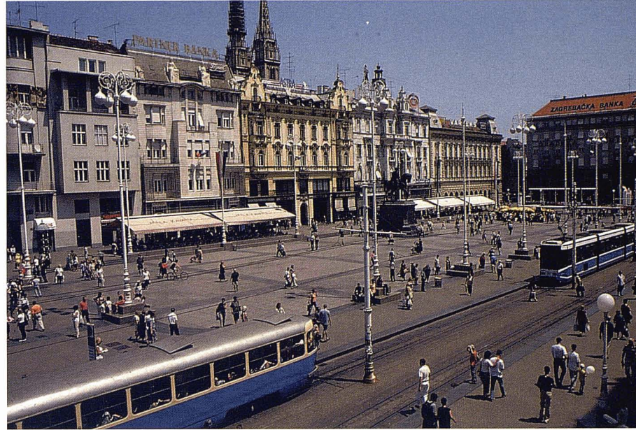
Zagreb, Croàcia.