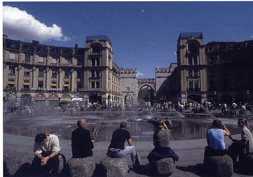
Karlsplatz de Munich.