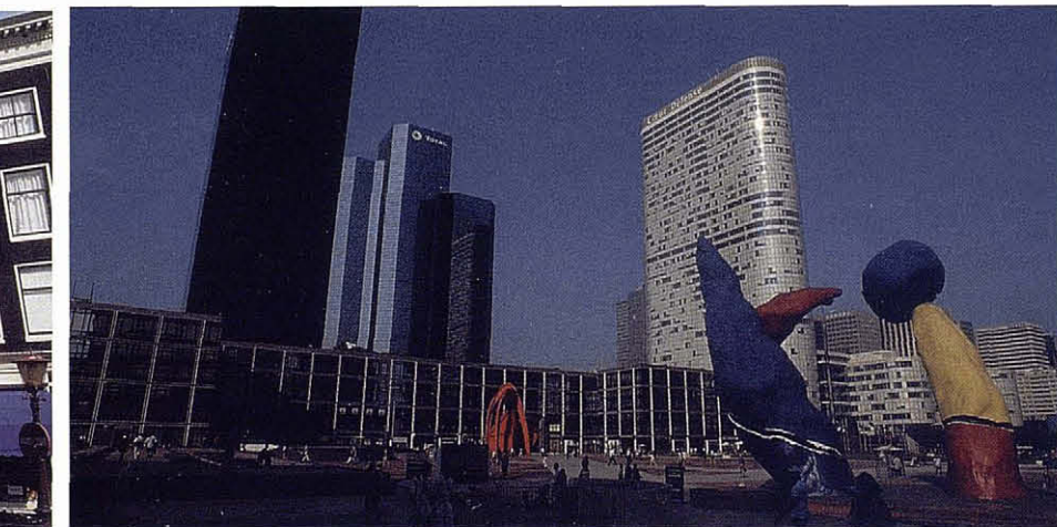
Escultures de Joan Miró a la Défense.