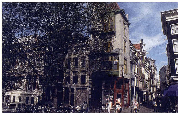
Carrer d’Amsterdam.