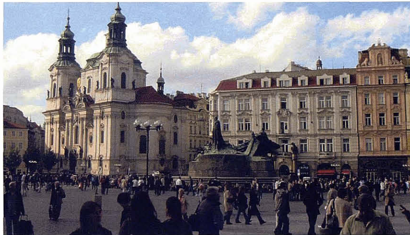
Plaça Staromestske de Praga.