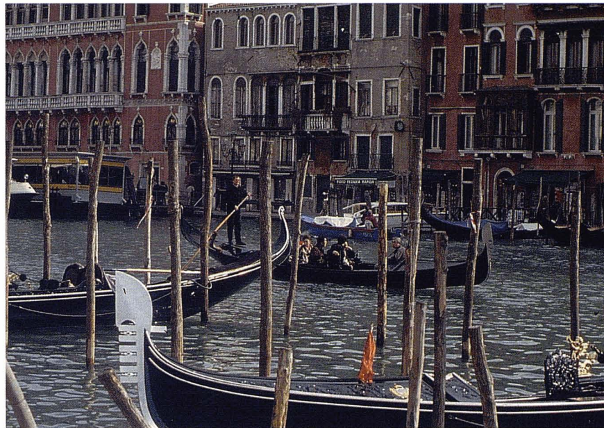
Canal de Venècia.