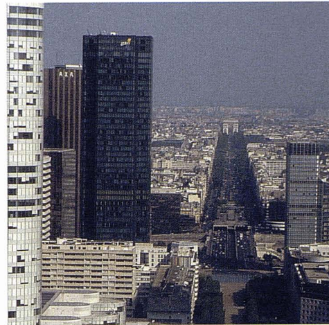
La Défense de París.