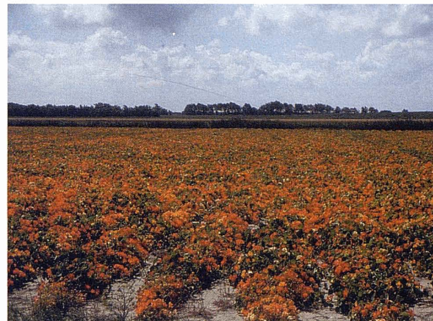
Conreu de flors als Països Baixos.

(al paisatge) i, per tant, donar lloc a una protecció jurídica particular. Si la creació de tal dret es fa independentment d'altres situacions jurídiques reconegudes pel Dret, llavors podríem parlar igualment de «dret autònom (al paisatge)». En aquest sentit, cal precisar que aquest tipus de dret no pot existir sense que se n'hagin identificat en primer lloc el(s) titular(s), la persona física o jurídica. Per la seva part, l'expressió «subjecte del Dret» és la conseqüència de la creació d'una o varies situacions jurídiques subjectives relatives a un interès particular. Des de aquesta perspectiva, el «dret al paisatge» podria representar el conjunt de les normes que es refereixen a la protecció d'aquestes situacions jurídiques subjectives i ser considerat com una branca autònoma del Dret o subepígraf del Dret ambiental.