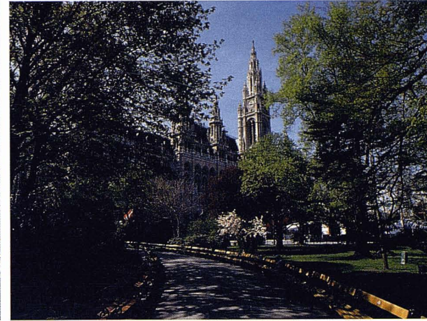
Rathaus de Viena.