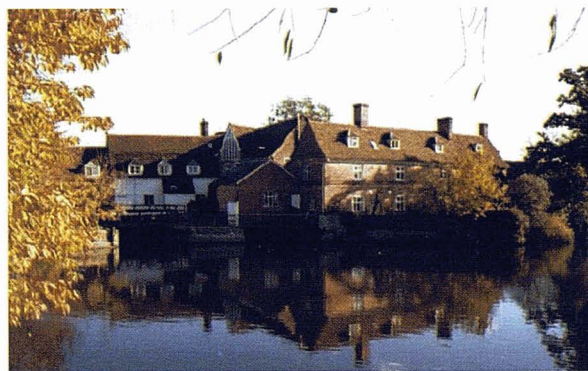
Northumberland, Gran Bretanya. Ian Britton. Fotografia cedida per www.freefoto.com