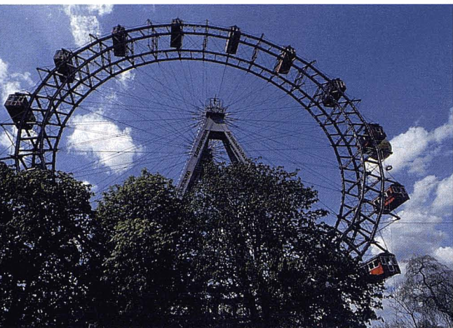
Nòria del Prater de Viena.