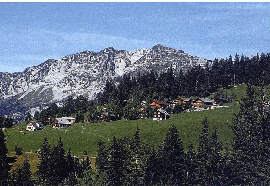
Amden, Suïssa.