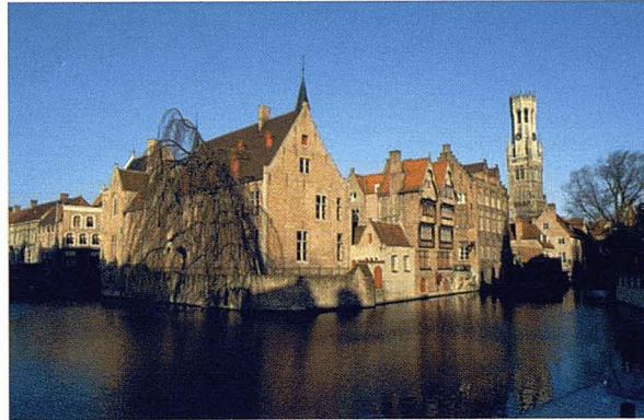
Flatford Mill, Gran Bretanya. Ian Britton. Fotografia cedida per www.freefoto.com

Canal de Bruges, Bèlgica. Ian Britton. Fotografia cedida per www.freefoto.com