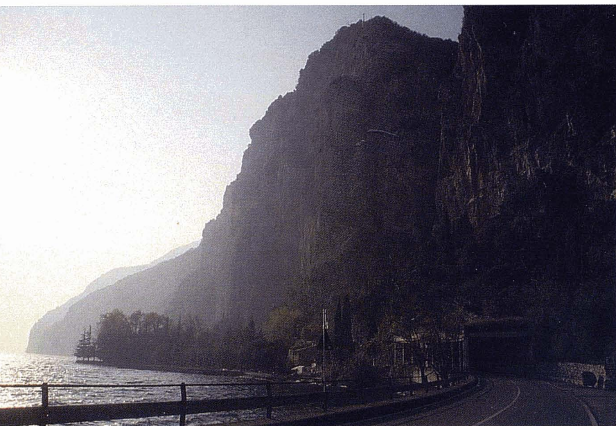
Llac de Garda, Itàlia.