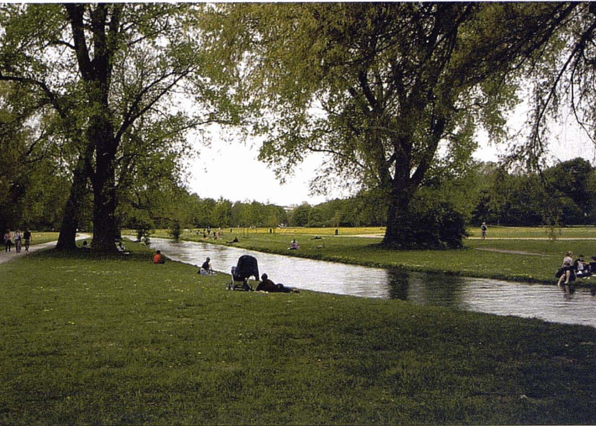
Jardí anglès.