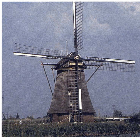
Típic paisatge dels Països Baixos.