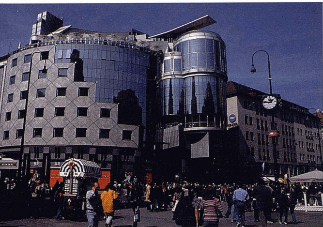
Casa Haas de Viena.