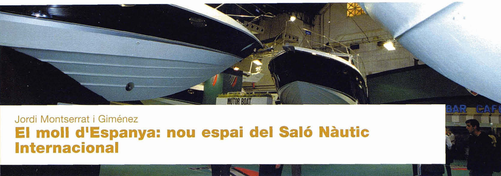
Saló Nàutic Internacional. R. Moreno