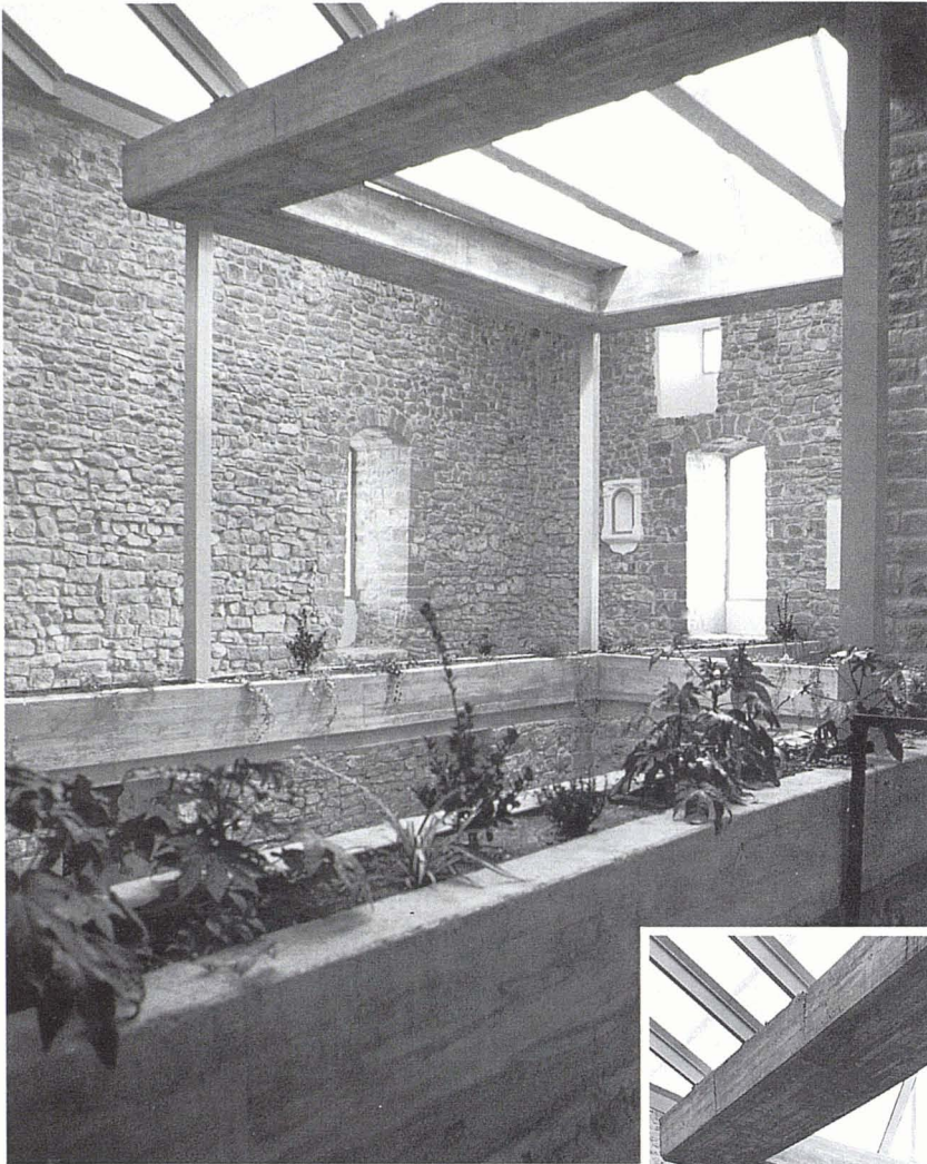
Interior del castell, amb la coberta nova sobre el pati central. S'hi observen elements que recorden els diferents usos que ha tingut el castell durant la seva història.