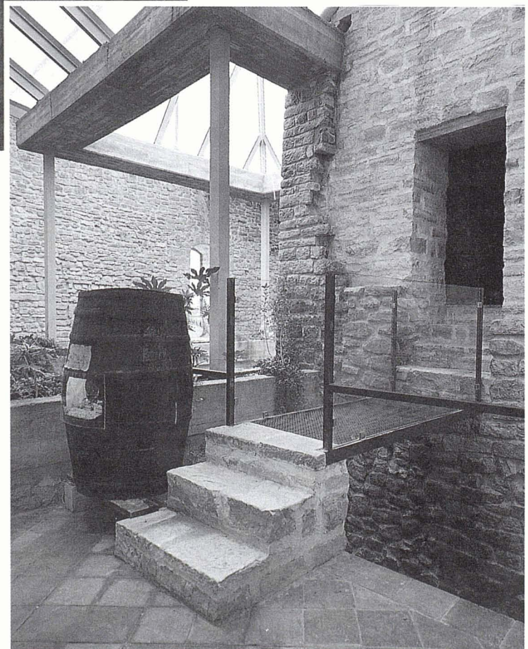
Entrada a la torre del segle XI recuperada.