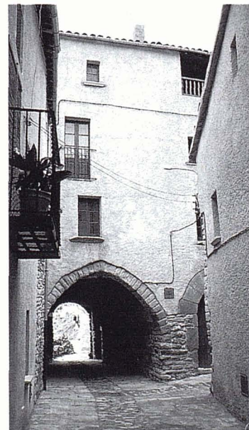
El carrer de Sant Climent amb el portal de Cardona ja restaurat.