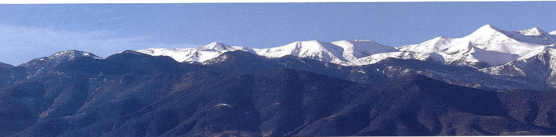
L'Alt Urgell des del mirador del Sot de la Pregona.

podem estar de braços plegats lamentant el que ha passat, recordant nostàlgicament allò que fou i que mai més no serà. Hem de passar a l'acció, no tant per a fixar definitivament el que hi ha, sinó per a preservar-ne i enaltir-ne els valors. Crec francament que el moment és propici perquè la societat ha madurat. El Govern de la Generalitat, en col·laboració amb les institucions catalanes sensibles a aquesta matèria, propugna un canvi substancial amb la introducció decidida del concepte de paisatge en les polítiques públiques. I això es fa a partir d'una doble consideració formulada per Oriol Nel·lo, secretari per a la Planificació Territorial: a) Sense la gestió del territori no és possible avui preservar i exaltar els valors del paisatge; i b) Sense el reconeixement i la defensa dels valors del paisatge no és possible gestionar el territori en benefici de la col·lec-