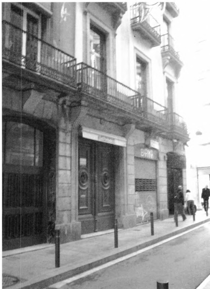
Imatge actual de l'indret on es trobava la impremta Galve, al carrer Avinyó, primer lloc assaltat per l'exèrcit la nit del 25 de novembre.