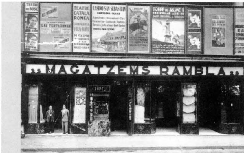
El primer pis de l'edifici de la Rambla de les Flors, entre la Boqueria i el Palau de la Virreina, fou el darrer lloc assaltat pels militars. Fotografia del temps de la II República.