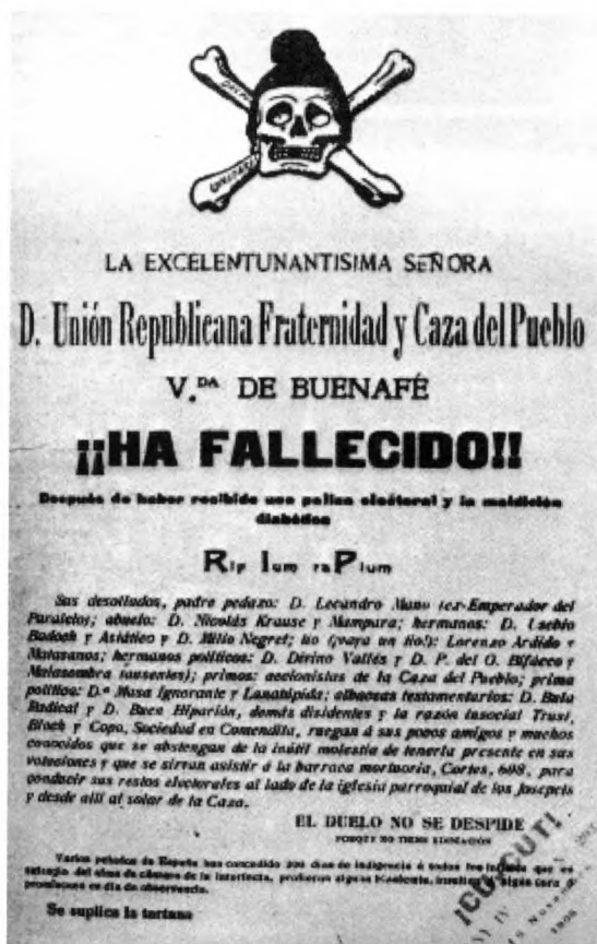
El setmanari ¡Cu-Cut! ironitza el 16 de novembre sobre la derrota electoral dels republicans del dia 12.

La suposada "regeneració" de l'Estat espanyol d'aquells anys no havia canviat cap estructura anquilosada ni cap tradició corcada. L'exèrcit no havia restituit la glòria perduda el 1898 i, més aviat al contrari, mantenia una imatge de cos ociós i fracassat que no admetia crítiques i que estava disposat a col·laborar,