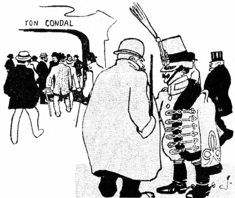
AL FRONTÓN CONDAL

—¿Qué se celebra aquí, que hay tanta gente? —El Banquet de la Victoria. —¿De la victoria? Ah, vaya, serán paisanos.