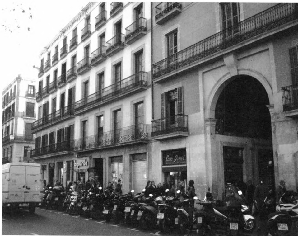
El mateix lloc, un segle després. Encara s'observa l'acabat diferent de les baranes del primer pis, que foren destrossades per les eines que portaren els soldats la nit dels assalts.