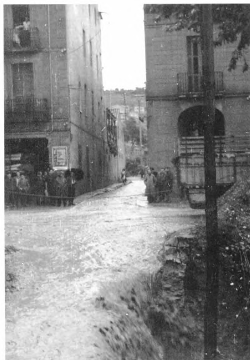
L'aigua de la riera Mariona va a parar a l'avinguda de Barcelona.

tament tot el seu personal i tots els vehicles de què disposaven, igual com van fer molts particulars. El dia 1 d'octubre també es van mobilitzar les quintes i es va demanar ajut a l'exèrcit; s'havien acabat els dies festius i els treballadors de les fàbriques que no havien quedat afectades