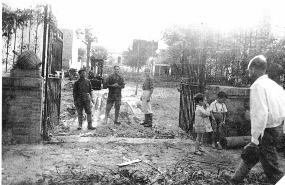
Pati del col·legi Alfons XIII; l'aigua va inundar-ne les aules.

Aquells dies tràgics, el poble es va quedar sense aigua i sense llum. El servei d'aigua va ser restituit tres dies després, però com que els pous de l'Urgellet i de Rafael Casanova s'havien inundat, durant un temps van recomanar a la població que no begués aigua de l'aixeta. L'avaria elèctrica la van reparar el mateix dia, però amb la mala fortuna que un operari de Fecsa va morir en la repa-