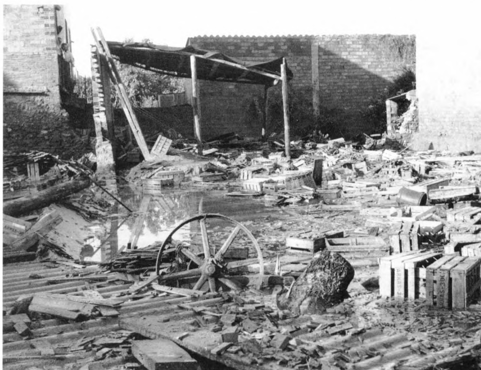
L'aigua va destrossar cases, fàbriques i tallers.

ajuntant la seva força, en confonien la procedència. En el moment de la gran avinguda pernoctaven, sota una de les arcades del pont de Carles III, resguardant-se de la pluja, una família gitana formada per setze persones; onze se les va endur l'aigua.