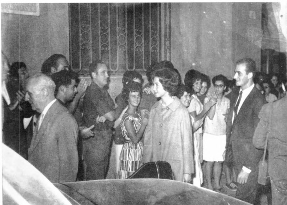
Ministres i directors generals van visitar les zones damnificades; també ho varen fer els que llavors eren prínceps d'Espanya.

ració del cablejat. El restabliment del servei elèctric va permetre treballar més activament en la neteja de les cases, els comerços i les fàbriques. I al cap de tres dies ja es va poder disposar d'algunes bombes per treure l'aigua de l'interior dels edificis, on, barrejada amb el fang, formava una capa compacta.