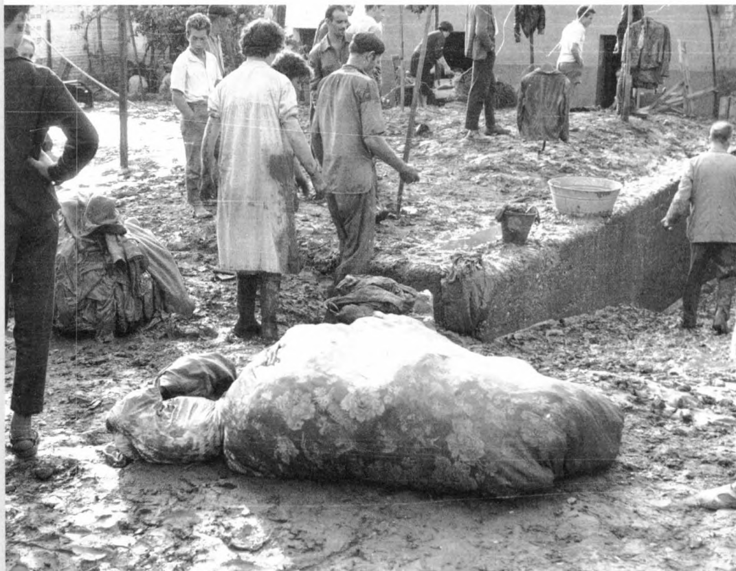
La força de l'aigua es va endur tot el que va trobar al seu pas.

de l'Habitatge va construir pisos destinats, preferentment, a les famílies damnificades al passatge del Molí. Les inundacions havien deixat inhabilitades algunes cases d'aquest passatge i havia esbotzat el pont de sobre el canal que comunicava el carrer de Rafel Casanova amb el