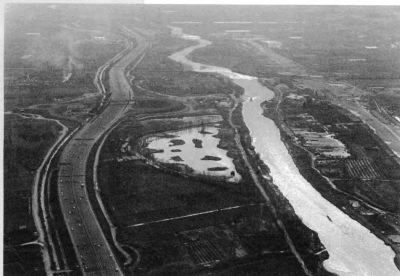
L'autopista, paral·lela al riu.

Els intents per defensar la terra i la seva gent de les grans avingudes del