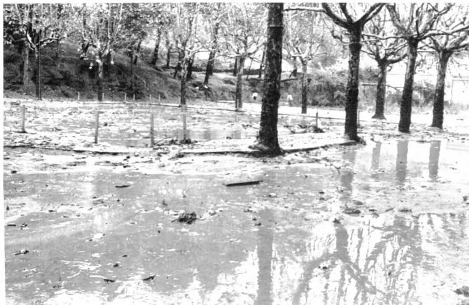
L'aigua entra a la Federació Obrera, n'inunda el pati i totes les dependències.

El dia 2 d'octubre, Franco visitava Molins de Rei. El periòdic Llobregat 9 descriu així la seva visita: "Si, cuando un Jefe del Estado llora, llega así a penetrar en el alma de su pueblo, en tales momentos de infortunio, como le sucediera al Generalísimo Franco nuestro Caudillo, será evidentemente por algo muy serio. Cuán infinitamente no será su amor hacia todos los españoles. Con ello, Franco no pudo sentirse más profunda e íntimamente identificado todavía en el dolor de su tragedia. Abrazando a las familias tan seriamente afectadas por las inundaciones, en un sazonado llanto de amor paternal ejemplar. Es algo insólito y que difícilmente se puede olvidar, el que un Jefe de Estado hasta llegue a penetrar así embargado por la viva emoción en el