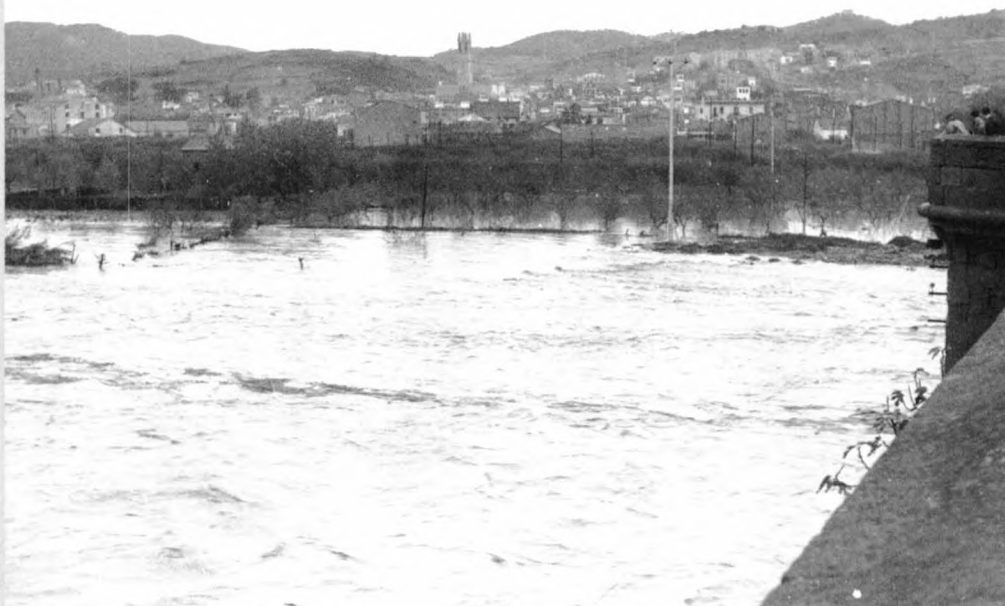
Les aigües del riu Llobregat a les portes de la vila.

quanta per donar sostre a les onades migratòries procedents del sud d'Espanya. Va arrasar cases i fàbriques, construïdes massa a prop de zones inundables. I centenars de persones van desaparèixer arrossegades per l'ímpetu de la rierada. A Molins de Rei van recuperar 44 cadàvers d'homes, dones i infants 5 , portats per les aigües del riu i del canal que,