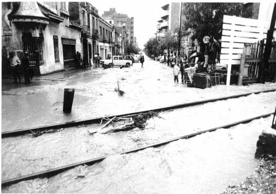
El carrer Verdaguer, inundat per les aigües procedents de la riera Nova.

tornaven a la feina. Un equip de 45 dones i 10 homes s'ocupava de proveir d'aliments a tot el personal civil i militar que treballava per retirar les runes i fer el poble habitable.