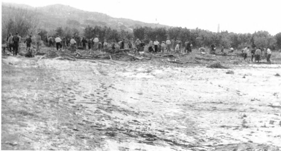
El 4 d'octubre es va acabar de rastrejar el riu.

passeig del Terraplè. El dia 11 de setembre de 1963, en presència del ministre de la Vivienda , van donar les claus dels pisos als damnificats. Eren pisos de renda limitada i en 20 anys quedaven amortitzats. En el mateix acte es va inaugurar el nou pont sobre el canal, que, a més, donà categoria de carrer al que fins llavors havia estat un passatge.