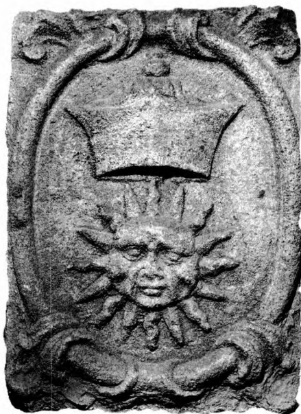
Escut situat a l'antic molí

Són només exemples. La inserció total requeriria un llibre sencer, com l'original.