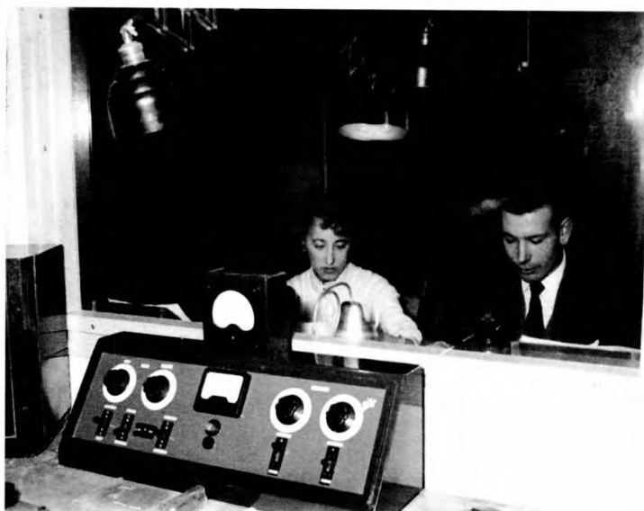
Instal·lacions de la primera ràdio de la vila.

Durant la Fira de l'any 1951 hom ja tenia la sensació que l'emissora tindria dificultats de subsistència si després del període de proves seguia emetent en ona curta. Aprofitant aquest esdeveniment local, que des de sempre ha tingut un gran ressò comarcal, es va iniciar una campanya per recaptar fons amb la col·laboració de la Comissió Organitzadora de la I Exposició Agrícola, Comercial i Industrial de Molins de Rei. També va rebre la primera crítica a causa de la gran quantitat de publicitat emesa en aquest període de proves. L'emissora no acabava de posar-se en marxa tot i les dues experiències realitzades. El motiu no era un altre que les dificultats per preparar tots els projectes que havien d'incloure qüestions artístiques, tècniques i econòmiques per tal que instàncies superiors els poguessin donar el seu vistiplau. La ràdio de Molins de Rei, o Radio Juventud de Molins de Rey, com així es donaria a conèixer, estava preparada. Tenia designat el quadre directiu, havia fet proves a locutors i locutores i disposava d'un local