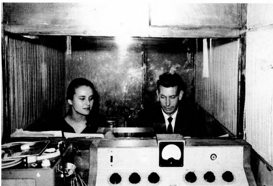
Primer locutori de "Radio Juventud de Molins de Rei".

Pretenem, doncs, fer una aproximació de quina ha estat la història de la nostra primera ràdio. Intentarem fer-ho amb el màxim rigor, malgrat que som conscients que hi poden haver llacunes importants, pel fet que no