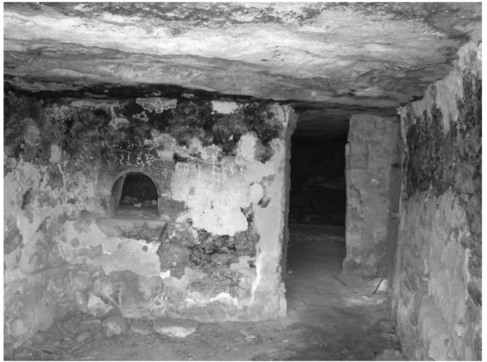
Forn, a l'interior de la Balma de les Set Portes - Casserres

Avui són cobertes per les aigües de l'embassament de la Baells, no obstant, en èpoques de forta sequera, aquestes cavitats són visibles des de la carretera.