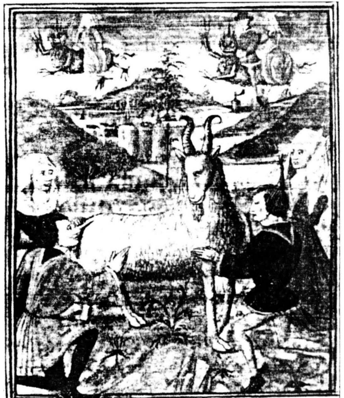
El Sàbat. D'un manuscrit de final s. XIV, Ms. 11209 Bibliothèque Royale, Brusel·les.