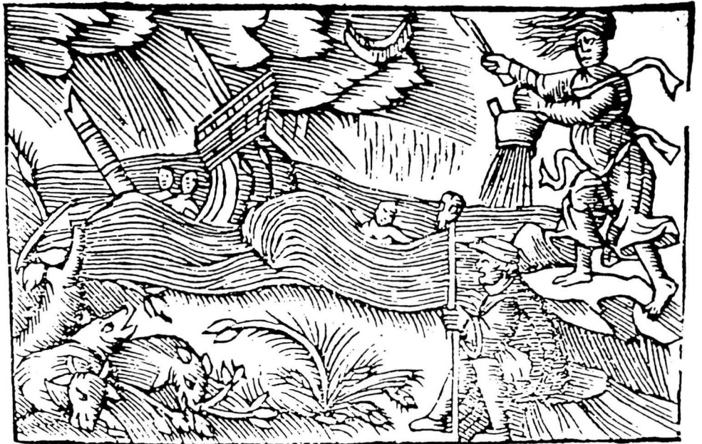
Un tempestari, fent tronar i ploure, enfonsa un vaixell. Xilografia extreta de la Història de Gentibus Septentrionalibus , Roma 1555.

Menys freqüents seran les imatges amb referència directa als mals provocats per les bruixes, sempre diferents i sempre catastròfics. Incendis, inundacions i terribles tempestes marítimes provocades