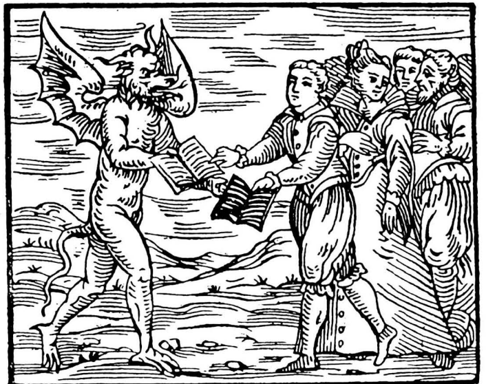
Substitució dels Evangelis pel llibre negre. Compendium Maleficarum , Milà 1626.