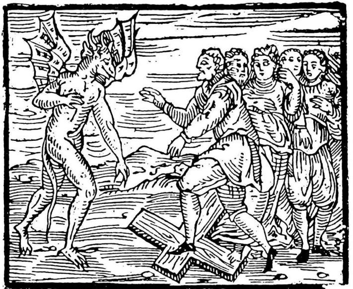
La profanació de la creu. Compendium Maleficarum , Milà 1626.