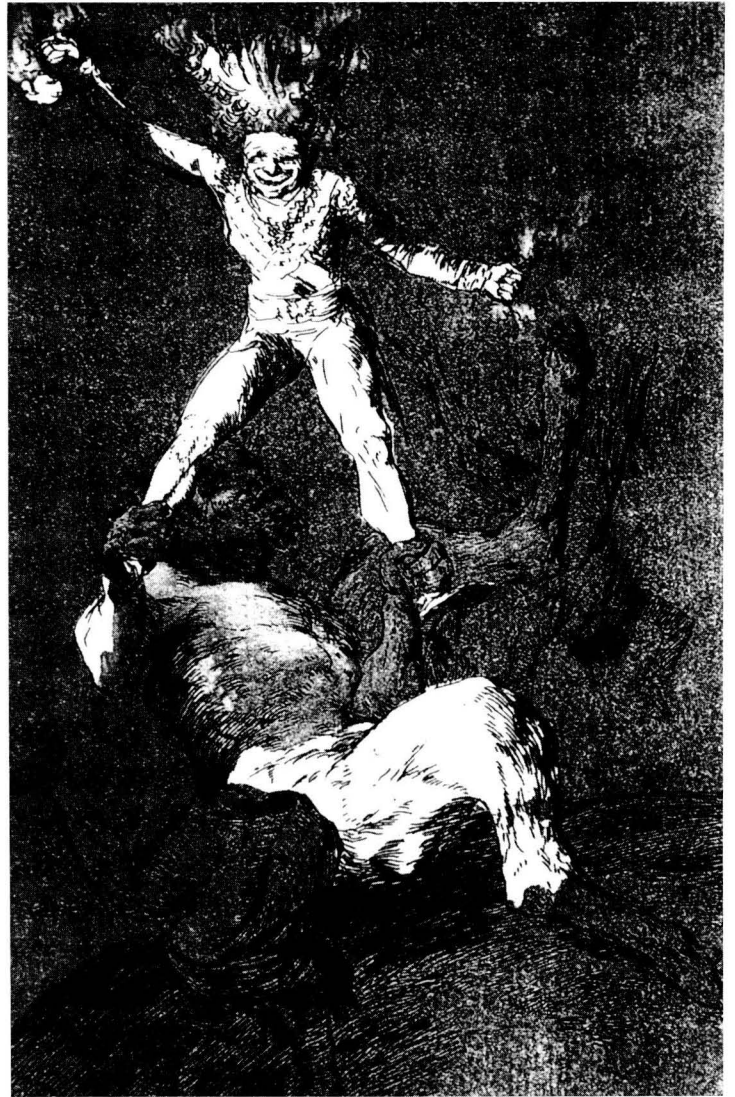
«Subir y bajar», de Fco. de Goya y Lucientes. Capricho núm. 56, Madrid 1799 Manuscrit de la Biblioteca Nacional: El Príncipe de la Paz levantado por la luxuria, y con la cabeza llena de humo, vibra rayos contra los buenos ministros. Caen estos y rueda la bola; que es la historia de los favoritos.