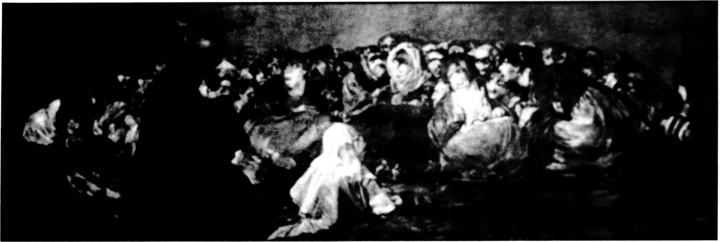
Aquelarre Museo del Prado «Quinta del sordo», 1820-22