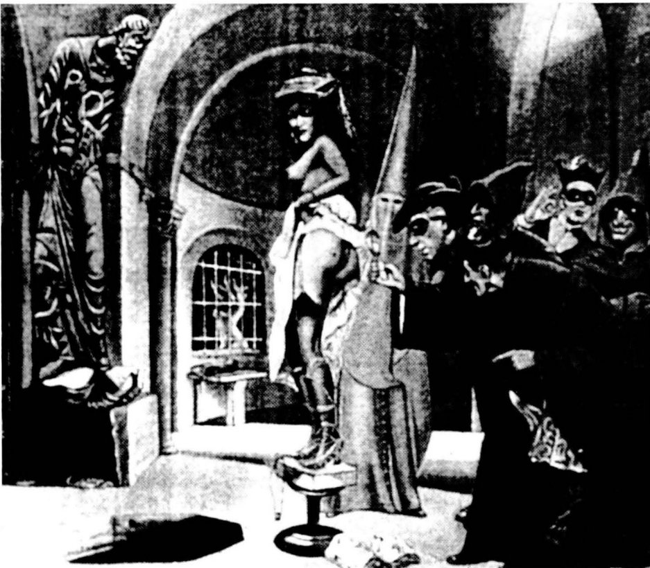
La recerca de la marca de les bruixes, de Clovis Trouille, 1961 Col·lecció particular.