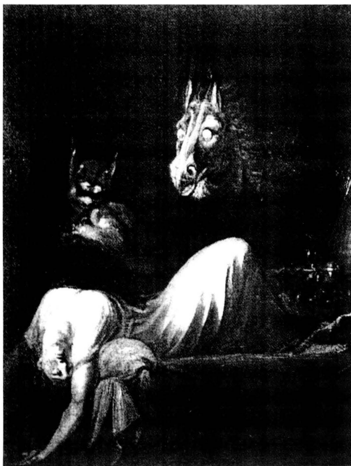
L'incube, 1781 Detroit Institut of Arts de Heinrich Füßli (o Fuseli).

sobre temes vinculats a la bruixeria es fa més gran coincidint amb les èpoques en què es combat més cruament el fenòmen. El camí, doncs, ja és obert. Gràcies a les constants millores de les tècniques d'impressió, diversos tractats de demonologia aniran il·lustrats amb algun tipus de gravat. Llibres com la Historia de gentibus septentrionalibus , d'Olaüs Magnus, Roma 1555 (Fig. 3); Ritter vom Turn (Augsburg 1498); De Lamiis et Pithonicis mulieribus dialogus d'Ulrich Molitor, (1489), amb tí-