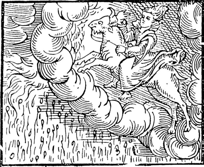
Bruixa en ple vol Compendium Maleficarum , Milà 1626. ARXIU A.R.B.